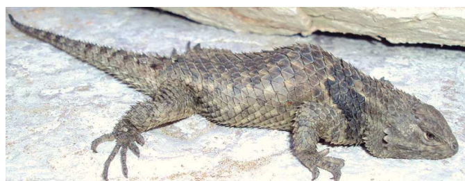
Figura 4. Ejemplar S. torquatus hembra con cifosis en las vértebras 12 y 13 (CV-R262).