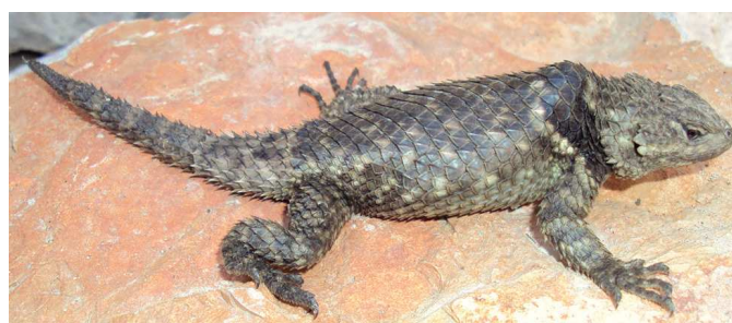
Figura 3. Ejemplar S. torquatus hembra con cifosis en las vértebras 7 y 8 (CV-R261).