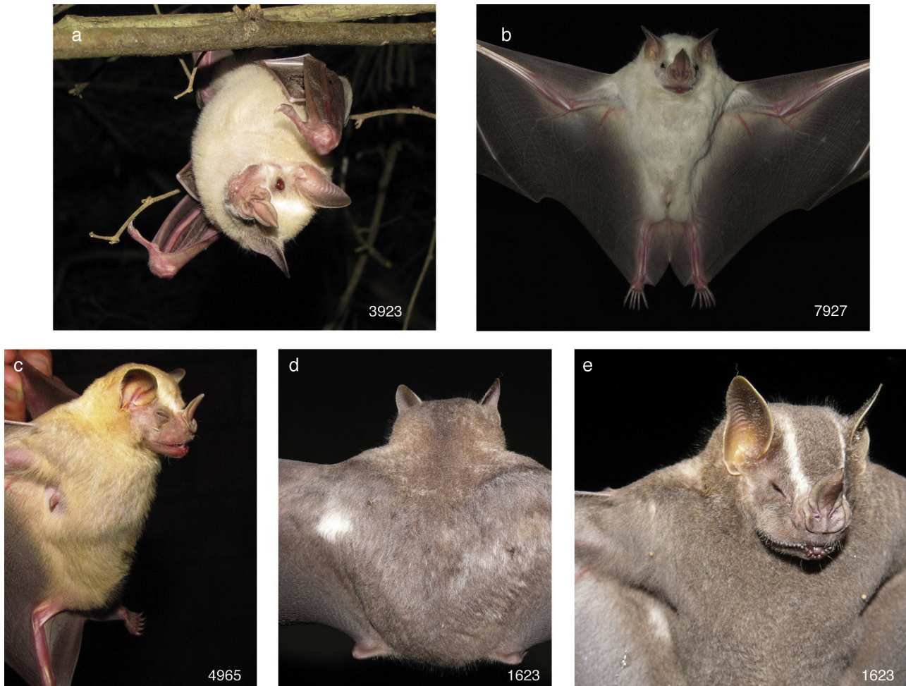
Figura 1. Artibeus lituratus : a) número 3,923, CF albino; b) número 7,927, CF manchas blancas; c) número 4,965, CF descolorido; d-e) número 1,623, CF manchas blancas, se observan en el dorso de la escápula izquierda (d) y en la parte ventral cerca a la axila derecha (e).

segundo ejemplar (número de campo 7,927) fue una hembra adulta inactiva capturada en bosque espinoso con remanentes de selva mediana subcaducifolia (29 de noviembre de 2012 a las 3:00 h). El antebrazo midió 65.6 mm y pesó 51 g. Se agrupó en la CF manchas blancas, porque el pelo de la cabeza y del cuerpo fue de color blanco, la hoja nasal y la base de las orejas de color claro, mientras que las membranas alares, el uropatagio y los ojos de color normal (fig. 1b). El tercer ejemplar (número de campo 4,965) fue una hembra adulta en lactancia que se capturó en bosque espinoso con remanentes de selva mediana subcaducifolia el 7 de julio de 2011 a las 22:00 h. El antebrazo midió 68.2 mm y pesó 51 g. Se asignó a la CF descolorido, porque el pelo de la cabeza y del cuerpo fue de color amarillo claro en lugar de gris o café negruzco, la hoja nasal rosa, mientras que los ojos, las orejas, las membranas alares y el uropatagio fueron de color café (fig. 1c). El cuarto murciélago (número de campo 1,623) se capturó en Jalisco, municipio de Puerto Vallarta, Área Natural Protegida Estero El Salado, sitio El Vivero, 20°40'32.76" N, -105°13'58.70" O, 85 m snm; fue una hembra adulta inactiva con un antebrazo de 69.0 mm que se capturó el 4 de octubre de 2008 a las 24:00 h en bosque espinoso con palmeras de coco ( Cocos nucifera ). Tuvo una mancha blanca en el dorso próxima al inicio del ala izquierda (fig. 1d),