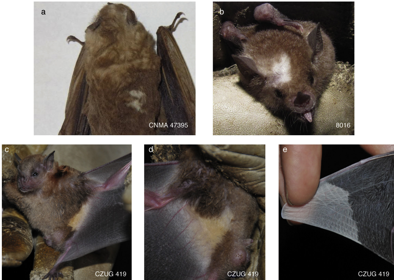
Figura 2. a) Artibeus lituratus (CNMA 47395), CF manchas blancas; b) G. soricina (8016), CF manchas blancas; c-e) Sturnira parvidens (CZUG 419), CF combinada manchas blancas-descolorido, el pelo de los costados de lado ventral es amarillo (c, d) y las puntas de las 2 alas son blancas (e).

Juchitán de Zaragoza, La Venta, 16°36'30.88" N, -94°47'21.70" O, 25 m snm, en selva baja caducifolia, el 21 de abril de 2011 a las 22:15 h. El antebrazo midió 39.2 mm y pesó 19.5 g. Se asignó a una CF combinada manchas blancas-descolorido, porque el pelo de los costados (fig. 2c) del lado ventral (fig. 2d) fue amarillo (CF descolorido), el resto del cuerpo y las membranas alares de color normal, pero las puntas de las 2 alas fueron de color blanco (CF manchas blancas; fig. 2e).