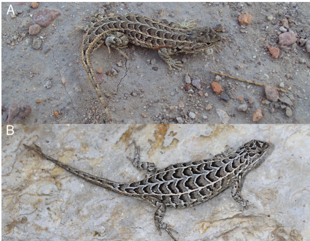
Figura 2. Vista dorsal de ejemplar macho (A) y hembra (B) de Sceloporus goldmani .

encontró diferencia significativa entre sexos al comparar la L.H.C. ( Z = -0.80 , p > 0.05 ; hembras = 11, machos = 10), la L.T. ( Z = -1.67 , p > 0.05 ; hembras = 09, machos = 10), el peso ( Z = -0.73 , p > 0.05 ; hembras = 11, machos = 10) y el número de poros femorales ( Z = 0.0 , p > 0.05 ; hembras = 11, machos = 10). Se encontró diferencia significativa entre sexos al comparar el número de escamas dorsales ( Z = 2.46 , p < 0.05 ; hembras = 11, machos = 10) y escamas ventrales ( Z = 1.97 , p < 0.05 ; hembras = 11, machos = 10), teniendo las hembras un mayor promedio en ambos casos. Las nuevas localidades de S. goldmani reportadas aquí se encuentran entre los 2,100–2,506 m snm y corresponden a planicies cubiertas de pastizal ( Bouteloua spp.) con encinos dispersos ( Quercus potosina ), izotales ( Yucca filifera ), agaves ( Agave lechuguilla , A. salmiana ), nopaleras ( Opuntia streptacantha ), mimosas ( Mimosa monacistra ), huizaches ( Acacia shaffneri ), biznagas ( Ferocactus histrix , Mammillaria uncinata , Stenocactus multicostatus ), jarillas ( Dodonaea viscosa ) y sotoles ( Dasyllirion acrotrichum ). Además, cabe mencionar que el ejemplar encontrado en la localidad al oeste de Los Encinitos, Pinos, Zacatecas, representa el registro de mayor altitud para la especie con 2,506 m.