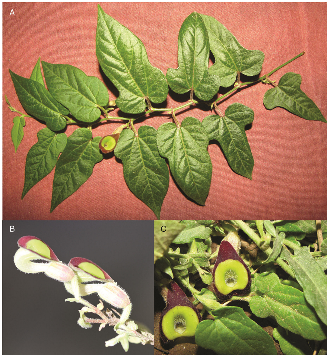
Figura 2. Aristolochia purhepecha Santana-Michel y Cuevas. A) Ramilla con hojas, estípulas, bractéolas y una flor; B) detalle de las flores en la que se observa el dobles del tubo y el limbo; C) limbo del cáliz con detalle del anillo, el color amarillo-limón concéntrico en la parte interna del limbo y lo piloso de la garganta (fotos A y C tomadas por F.J. Santana Michel del holótipo y B tomada por R. Cuevas G. de un ejemplar en cultivo).

Distribución y hábitat: bosque tropical subcaducifolio con Astronium graveolens Jacq., Brosimum alicastrum Sw., Enterolobium cyclocarpum (Jacq.) Griseb., Trichilia americana (Sessé y Moc.) T.D. Penn., y Sloanea terniflora (DC.) Standl.