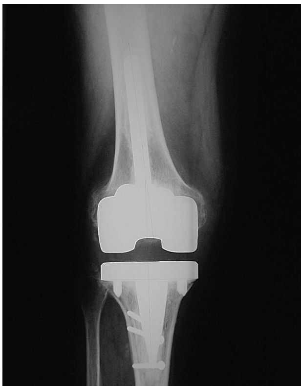
Figura 2. Radiografía anteroposterior de un recambio de prótesis total de rodilla.

Seral B, et al. Vástagos cementados en recambios de prótesis totales de rodilla