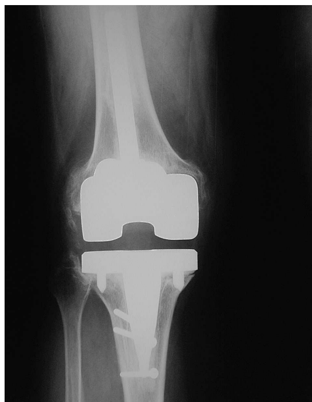
Figura 4. Radiografía anteroposterior del mismo caso de las figuras 1 y 2, a los 4 años de evolución.

En la actualidad existen pocos estudios publicados en relación a los resultados de los recambios de prótesis de rodilla, con pocos trabajos prospectivos donde se tengan en cuenta los parámetros utilizados para la selección del tipo de implante. No existe un consenso sobre el momento oportuno para el recambio, la técnica quirúrgica y el tipo de implante más adecuados. Saleh et al 12 proponen una puntuación preoperatorio para los casos de fracaso de artroplastias primarias de rodilla, basado en aquellos factores que pueden influir en el resultado final. La salud física y mental del pa-