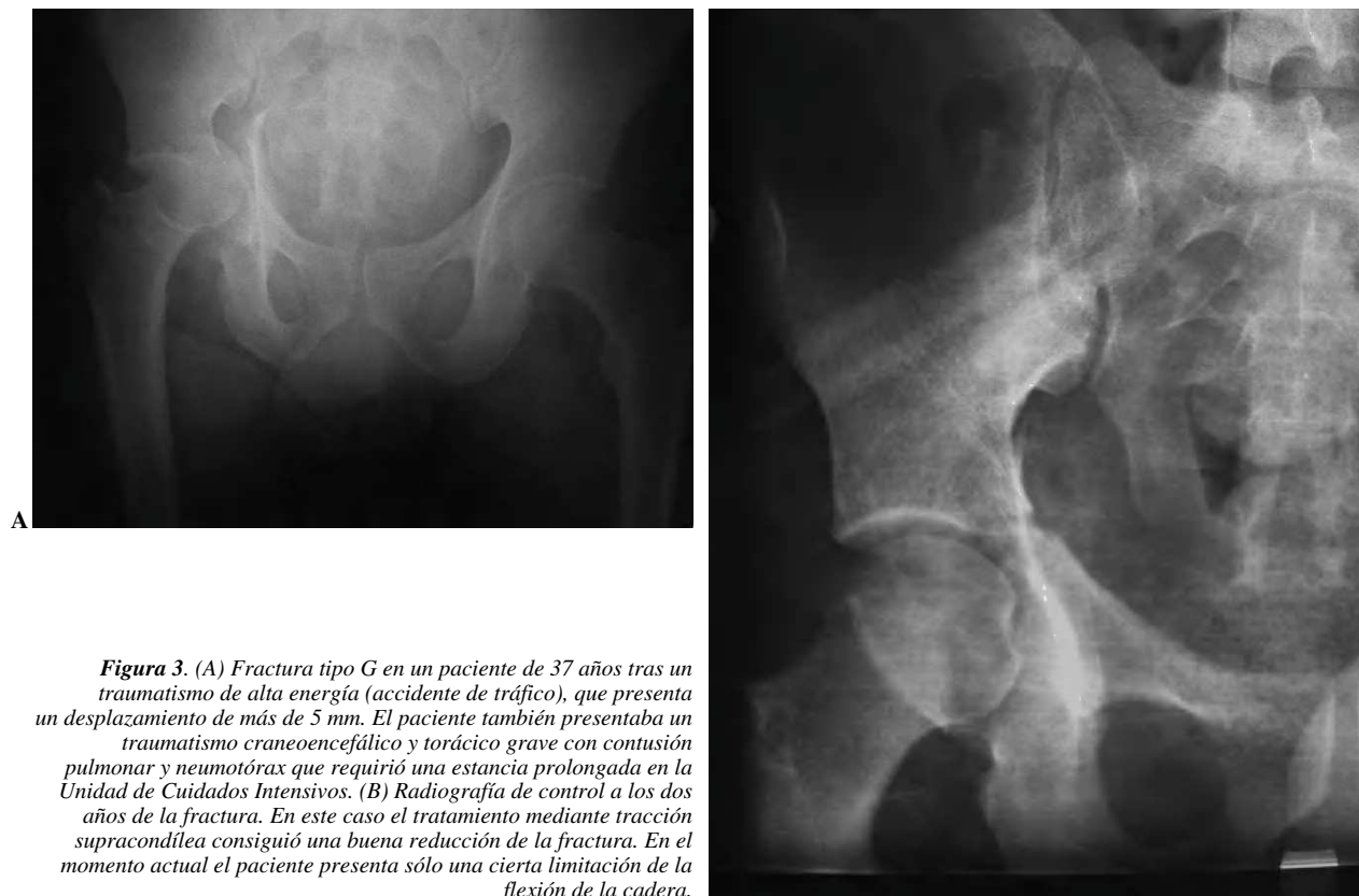
Figura 3. (A) Fractura tipo G en un paciente de 37 años tras un traumatismo de alta energía (accidente de tráfico), que presenta un desplazamiento de más de 5 mm. El paciente también presentaba un traumatismo craneoencefálico y torácico grave con contusión pulmonar y neumotórax que requirió una estancia prolongada en la Unidad de Cuidados Intensivos. (B) Radiografía de control a los dos años de la fractura. En este caso el tratamiento mediante tracción supracondílea consiguió una buena reducción de la fractura. En el momento actual el paciente presenta sólo una cierta limitación de la flexión de la cadera.

La calidad de la reducción determina el resultado clínico. Con una reconstrucción anatómica se obtienen en torno a un 80% de buenos resultados, pero cuando la reducción es mala los resultados buenos bajan a cerca del 30% 4 . Las series publicadas señalan resultados buenos y excelentes entre el 57% y el 87,5% de los casos 4-7,9-19 . Los factores de riesgo para un mal resultado son la edad avanzada 10,12,13,16,17 , la necrosis avascular de la cabeza femoral 9,12,16,17 , la luxación de cadera asociada 9,12 , las osificaciones heterotópicas 3,12,20 , el retraso de la cirugía 6,15 , o el desplazamiento de los fragmentos superio-