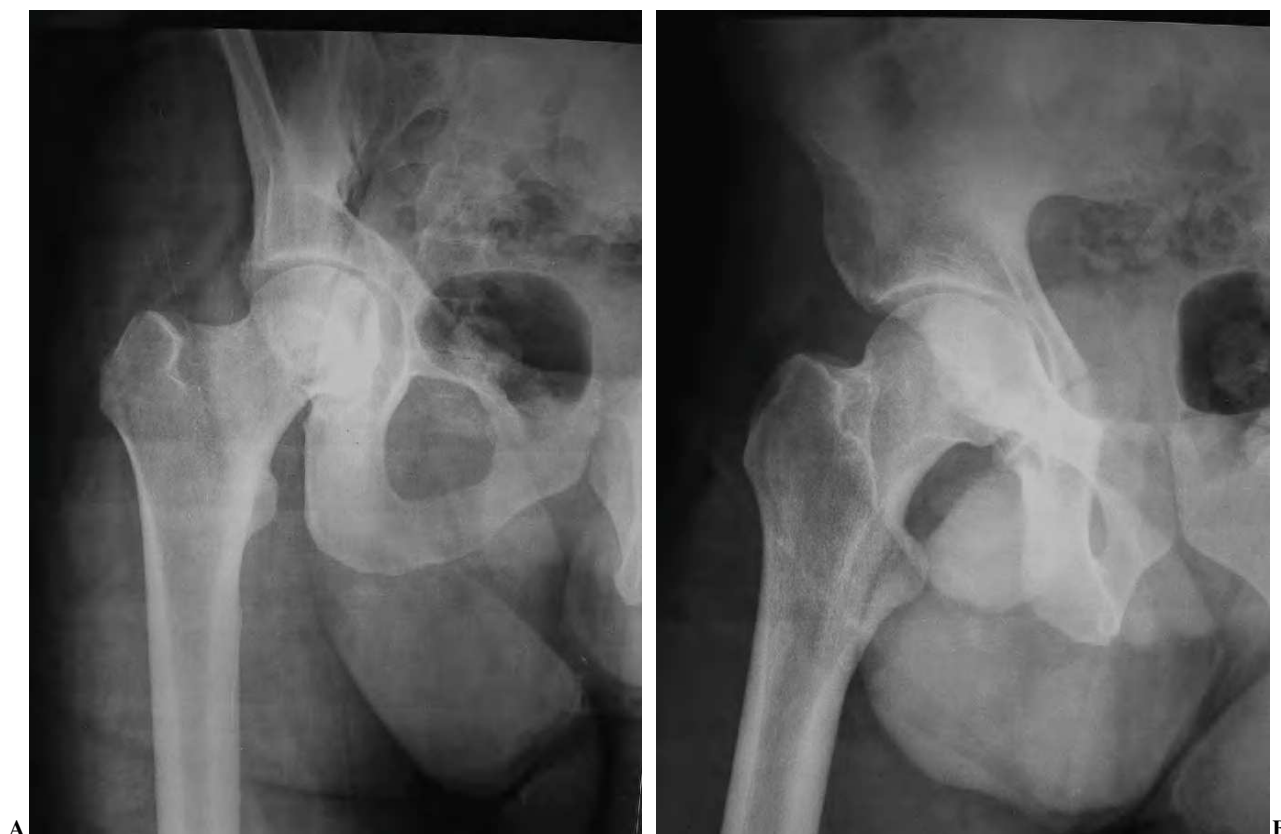
Figura 2. (A) Radiografía anteroposterior de una fractura de columna posterior en una mujer de 70 años tras un traumatismo de baja energía. (B) Proyección alar de la misma fractura que permite una mejor visualización de la columna posterior, comprobándose la ausencia de desplazamiento de la fractura.

de los casos la fractura afectaba al fondo del cotilo, siendo la columna anterior la zona afectada más frecuentemente (84%), seguida por la columna posterior en un 52% de los casos. Si bien en el 40% de los casos hubo pérdida de movilidad (sobre todo flexión), sólo había signos degenerativos en el 16%, y solamente un paciente presentó dolor con el