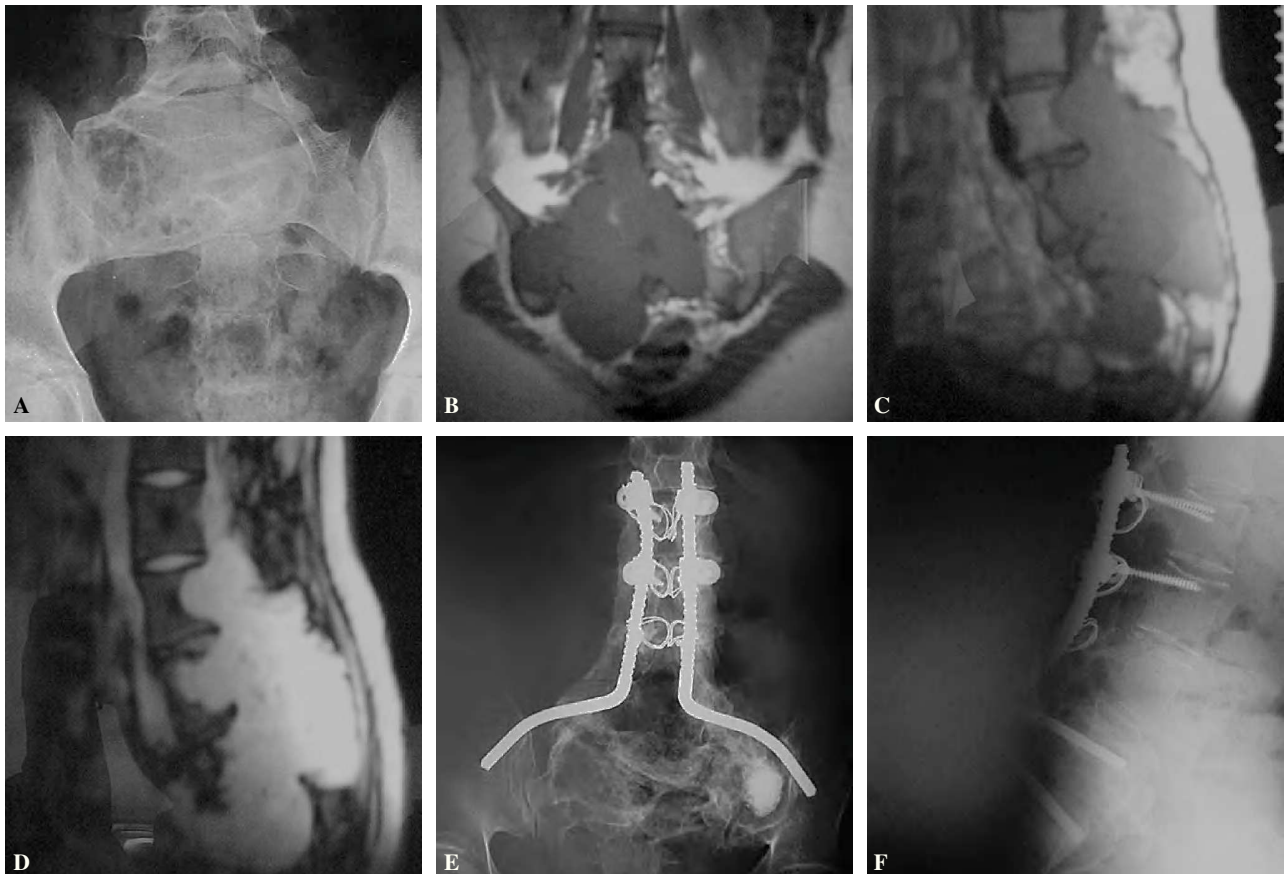
Figura 3. Paciente n.º 3. Schwannoma lumbosacro. (A) Radiografía anteroposterior preoperatoria. (B) Resonancia magnética (corte coronal T1 preoperatoria). (C) Resonancia magnética (corte sagital T1 preoperatoria). (D) Resonancia magnética (corte sagital T2 preoperatoria). (E y F) Radiografías anteroposterior y lateral postoperatorias (seguimiento a 5 años).