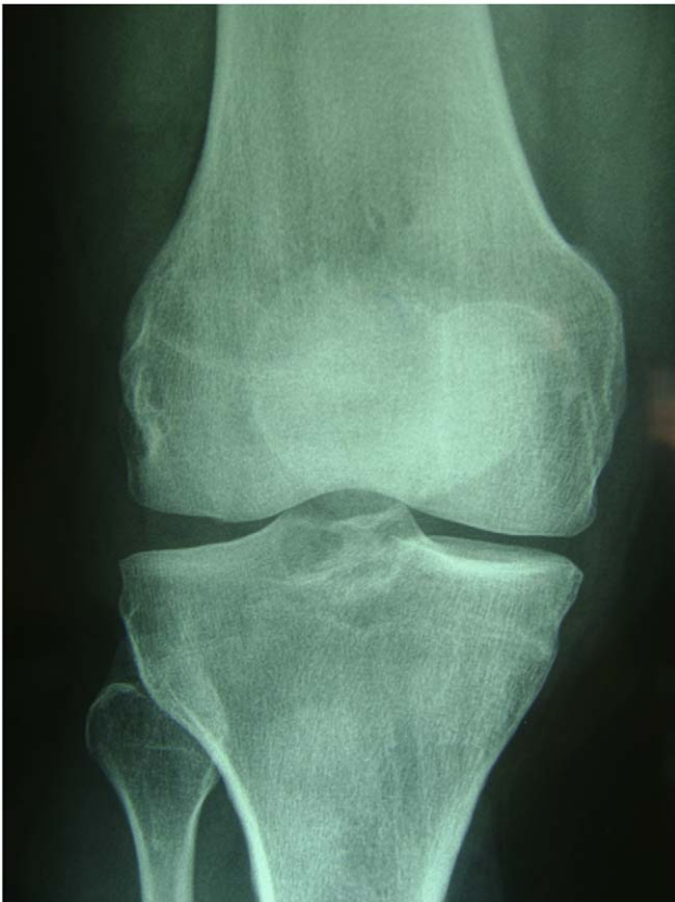
Figura 1 Radiografía simple de la rodilla afectada en el caso número uno.