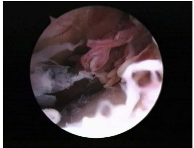
Figura 3 Visión artroscópica que muestra sinovitis nodular.

semanas, momento en que se consideró la curación de la infección.