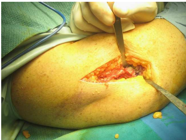
Figura 2 El abordaje lateral permite el tratamiento de la fractura de la cabeza radial, fracturas de la punta de la coronoides y la reparación del complejo del ligamento colateral externo.