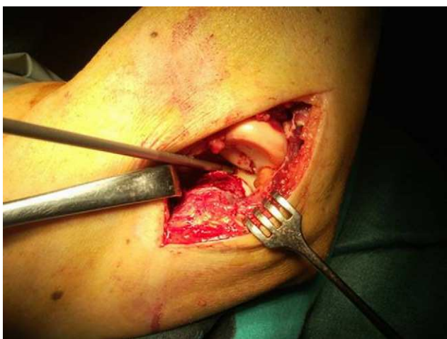
Figura 3 Reparación de la cápsula anterior en una fractura de la punta de la coronoides con un arpón. El acceso es posible desde un abordaje lateral incluso sin la extirpación de la cabeza radial.

semanas se evitaron la extensión y supinación completas. A las 3 o 4 semanas se inició la movilización completa pasiva, y a las 6 semanas se autorizó la movilidad activa sin restricción.