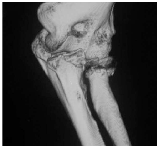
Figura 1 La tomografía axial computarizada (TAC) es fundamental en la valoración preoperatoria de estas lesiones y nos ayuda a entender mejor cuales son las estructuras afectadas y como podemos encarar su reparación.

El tratamiento quirúrgico protocolizado en las tríadas de codo 6,8,9 . Los principios de la técnica fueron restaurar la