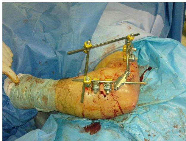
Figura 5 Fijador externo colocado cuando tras la reparación persiste una inestabilidad residual.

desarrolló una osteólisis menor, de 2 mm, en la unión del vástago de la prótesis de cabeza radial con la diáfisis sin repercusión funcional ni progresión radiológica.