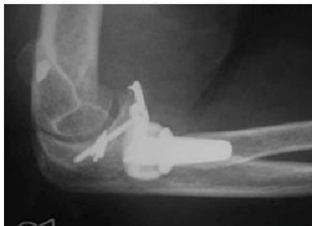
Figura 4 A,B) El tratamiento comprende una artroplastia de la cabeza radial (fractura conminuta imposible de sintetizar), osteosíntesis de la coronoides con una placa específica para ello a través de un abordaje medial adicional y reparación ligamentosa de ambos complejos con suturas con arpones.