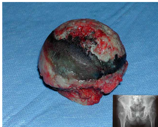
Figura 2 Artropatía ocronótica de cadera: imagen macroscópica de la cabeza femoral y radiografía a-p de ambas caderas.

esqueleto y cuantificación de ácido homogenístico en orina de 24 h, confirmándose el diagnóstico microscópico, apreciando calcificación de discos articulares en columna dorsolumbar y alcaptonuria. En años siguientes desarrolla gonartrosis bilateral, por la que es intervenida en marzo de 2007 de artroplastia total de rodilla izquierda. Durante el acto quirúrgico se aprecia nuevamente una gran tinción oscura del cartílago articular y tejidos periarticulares (fig. 1).