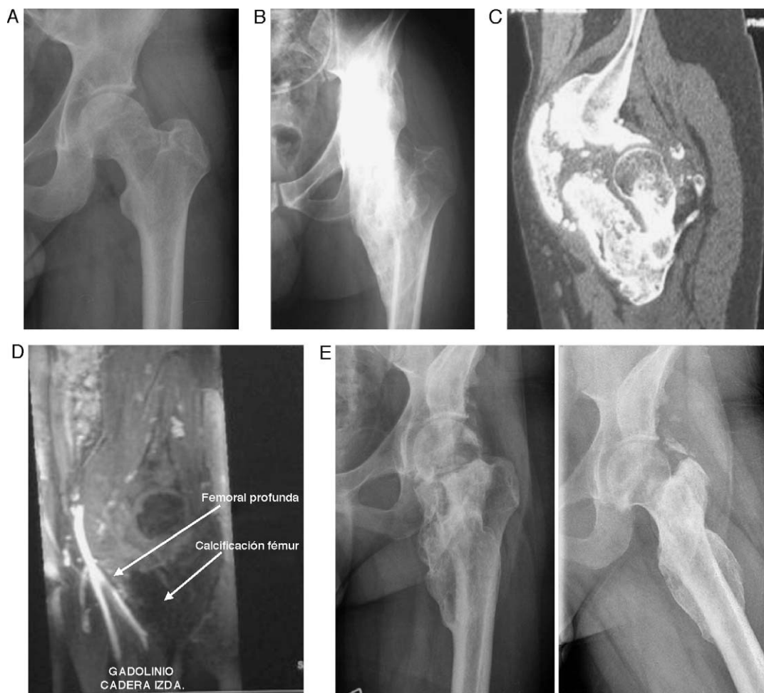
Figura 1 Imágenes correspondientes al caso 1. A) Radiografía de cadera izquierda a los 6 meses del traumatismo sin osificación visible. B) Osificación anteromedial desde pala iliaca a fémur proximal. C) TC de cadera donde se aprecia la osificación heterotópica de localización anteromedial, que engloba el músculo psoas iliaco. D) Angio-RM: desplazamiento de la arteria y la vena femoral por la osificación y relación con la arteria circunfleja lateral. E) Radiografía anteroposterior y axial a los 24 meses de la cirugía.

Aunque no existen estudios con nivel de evidencia 1 que justifiquen qué medidas profilácticas postoperatorias se deben realizar para evitar la recurrencia de las OHN, se utiliza la rehabilitación precoz, la indometacina, los difosfonatos o la radioterapia. Ambos pacientes siguieron un plan de rehabilitación intensivo mediante ejercicios de movilización pasiva de 4 h diarias desde el postoperatorio inmediato y se utilizó una pauta de 25 mg de indometacina cada 8 h durante 15 días.