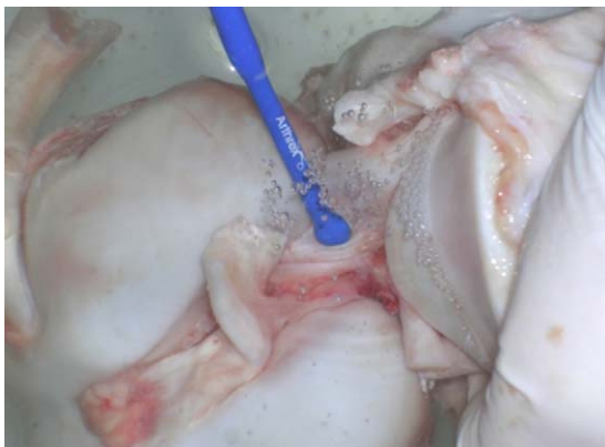
Figura 3 Observamos la aplicación de RF sobre la rotura parcial del LCA. Se simularon condiciones artroscópicas para el tratamiento con RF.

un poder estadístico de 90%. El análisis fue realizado con el software SPSS versión 15.0 para Windows.