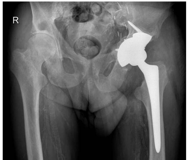
Figura 4 Resultado radiológico de artroplastia total de cadera con uso de suplemento de tantalio.

Tras tres años de evolución el paciente se encuentra asintomático y sin observarse movilizaciones radiográficas de su artroplastia. Se encuentra en seguimiento por el servicio de Reumatología y Nefrología con tratamiento específico para su amiloidosis.