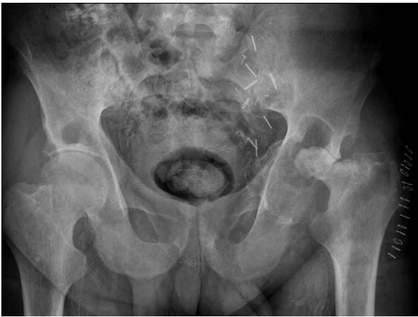
Figura 1 Rx AP de pelvis en la cual se observa una marcada osteólisis de la parte superior del acetábulo y destrucción global de la cabeza femoral.

de la región iliaca y de la cabeza femoral con la presencia de un amplio derrame articular (fig. 2). Ante la evolución progresiva de este proceso y la falta de diagnóstico definitivo se decide realización de biopsia ósea y articular abierta de la articulación coxofemoral para descartar proceso tumoral, infeccioso o enfermedad por depósito.