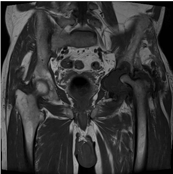
Figura 2 RM. Secuencia coronal T1 donde se observan amplias erosiones en cavidad acetabular y destrucción de cabeza femoral acompañado de amplio derrame articular.

La evolución agresiva de este proceso nos obliga a realizar un diagnóstico diferencial en el que debemos descartar artritis infecciosas, artritis microcristalinas o enfermedades por depósito como la amiloidosis. Además de estas patologías debemos descartar la presencia de un proceso tumoral, siendo la posibilidad diagnóstica más frecuente por el rango de edad del paciente y la localización, el mieloma múltiple o enfermedad metastásica. La afectación tan extensa del