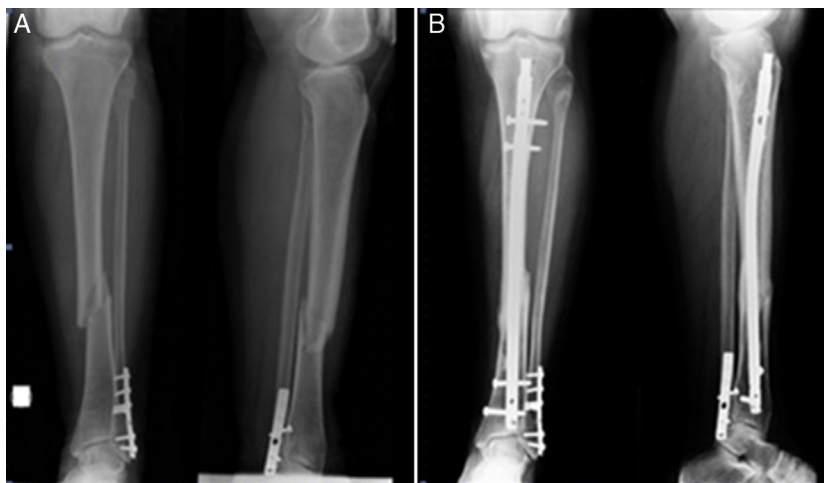
Figura 1 A) Fractura diafisaria de tibia. Se observa material de osteosíntesis de peroné distal con fractura consolidada. B) Seis meses desde el postoperatorio.