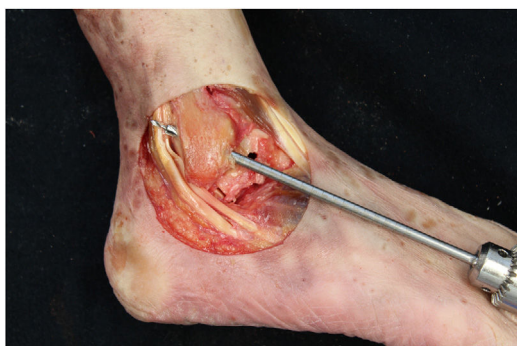
Figura 4 Tobillo derecho. Brocado en huella anatómica del túnel fibular con inclinación de 50° en sentido distal-anterior a proximal-distal.