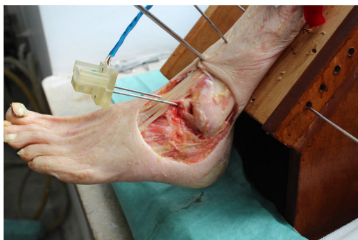
Figura 2 Instrumento de medida. Detalle del sensor localizado en el astrágalo.

desarrollada para el uso de un microcontrolador Arduino Mega 2560, con la ayuda del Mpu6050, una unidad de medición inercial (IMU) 16 . Mediante un algoritmo de fusión fue posible la adquisición e interpretación de los datos recibidos por la IMU. El software permitió analizar el desplazamiento angular del astrágalo, en tres planos simultáneamente, en tiempo real, utilizando los ángulos de Tait-Bryan 17 .