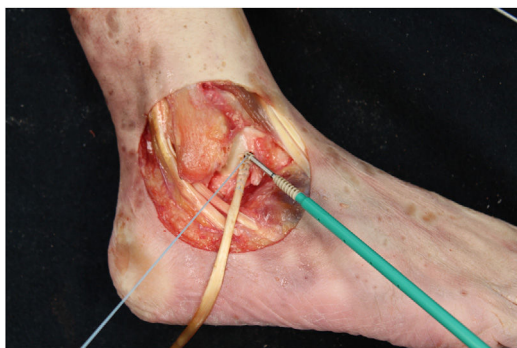
Figura 5 Tobillo derecho. Inserción de plastia tendinosa de EHL en túnel ciego talar y posterior fijación con anclaje de 4,75 mm.