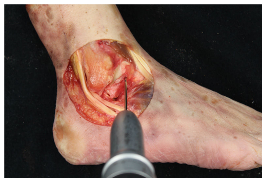
Figura 3 Tobillo derecho. Aguja guía en huella anatómica talar del LTFA para posterior brocado de un hemitúnel de 5 x 25 mm.

Para valorar la estabilidad empleamos las maniobras de cajón anterior (CA) y de estrés en varo (EV), de manera análoga a la práctica clínica 18 . La fuerza es aplicada manualmente, siempre por el mismo investigador, respetando la realización de las maniobras de estabilidad en el mismo