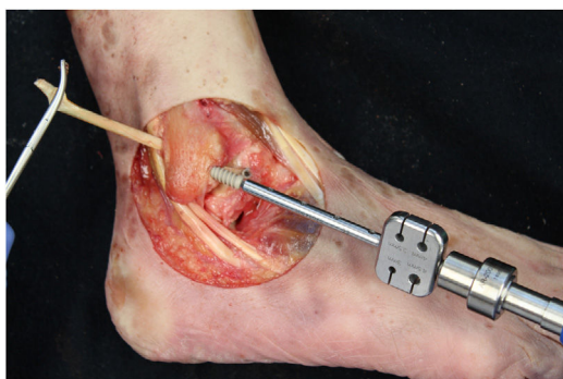
Figura 6 Tobillo derecho. Introducción de la plastia por el túnel fibular y fijación con tornillo de biotendosis de 5,5 mm.

astrágalo y la fijamos con un anclaje de 4,75 mm (Swive-Lock Arthrex Inc.) (fig. 4). El extremo opuesto lo pasamos a través del túnel fibular y lo estabilizamos con un tornillo de biotendosis de 5,5 x 20 mm (BioComposite Tenodesis Screw, Arthrex Inc.) (fig. 5). Durante la fijación, es importante mantener el tobillo en una posición de ligera eversion y dorsiflexión neutra. Cada túnel es recomendable realizarlo 0,5 mm mayor que el diámetro de la plastia, para facilitar el paso de la misma. Repetimos ambas maniobras (CA y EV), con la técnica de reconstrucción realizada (fig. 6).