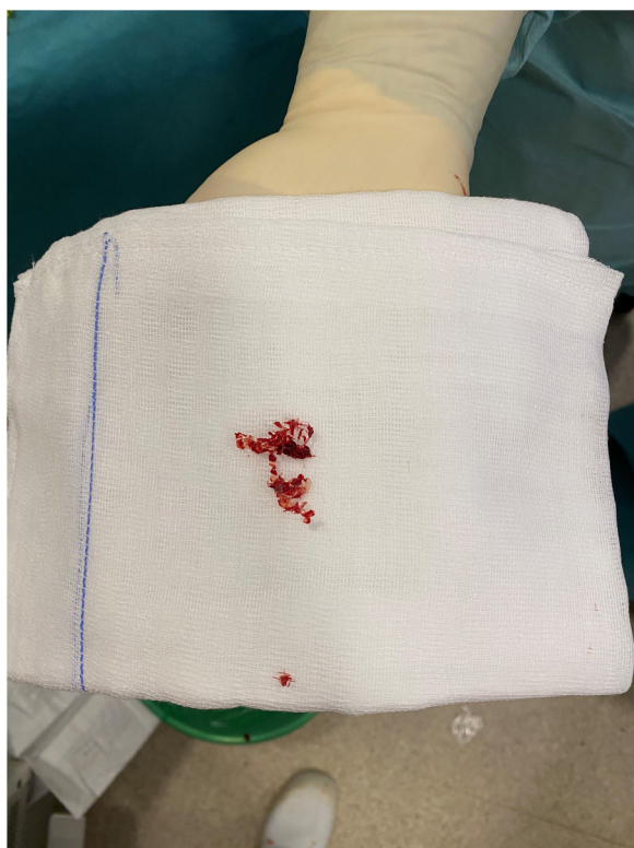
Figura 5 Tapón de plástico extraído sin dificultad enrollado en la broca.

de pinzas. Según se va profundizando en el canal óseo la visualización de la interfaz se hace más difícil y se va perdiendo el control sobre la dirección del escoplo. Todo ello facilita las falsas vías y las fracturas intraoperatorias 4,5,12,13 . La técnica que describimos parece evitar en gran medida estas complicaciones, puesto que la broca o fresa que usamos siempre está guiada y controlada por la guía que queda firmemente unida con tornillos de 4,5, de hecho, en nuestro grupo no tuvimos ninguna complicación de este tipo.