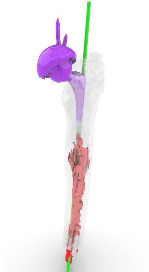
Figura 4 En morado, vástago movilizado (exeter de longitud 95 mm). En rojo, el cemento que impide implantar un vástago mayor. En verde, diseño del trayecto deseado de la broca para retirar cemento y permitir alojar un vástago mayor.

Realizamos esta técnica en dos pacientes. En uno de ellos para retirar un tapón de cemento en fémur y un tapón de cemento en tibia para posteriormente implantar una prótesis de rodilla modelo bisagra rotacional (Endo Model de Waldemar Link®) con vástagos de 200 y 160, respectivamente. En el segundo paciente retiramos el tapón de cemento del fémur para recambiar un vástago Exeter (Stryker®) movilizado por otro más largo (fig. 4).