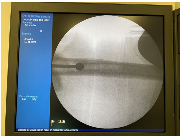
Figura 3 Fresa circular de 11 mm perfectamente centrada en el canal femoral con ayuda de la guía 3D.

del cemento (que sería necesaria en el caso de recambios sépticos), sino dejar suficiente espacio para el paso de un nuevo vástago más largo.