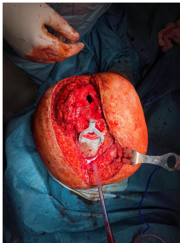
Figura 1 Imagen intraoperatoria, con guía 3D aplicada al fémur para fresar el cemento intracanal de manera controlada.

Seleccionamos tres casos con el diagnóstico de movilización aséptica de componentes cementados. En todos los casos se realizó el diagnóstico mediante radiología simple y tomografía axial computarizada (TAC) con cortes de 1 mm, junto con un estudio de laboratorio en el que se descartó leucocitosis y aumento de marcadores inflamatorios (velocidad de sedimentación globular, proteína C reactiva y fibrinógeno) de manera a descartar procesos infecciosos. Se objetivó la necesidad de retirada de los implantes y sustitución por otros más largos, lo que obligaba a tener que extraer el cemento distal (tapón de cemento). Para realizar esta labor de extracción del cemento distal ideamos una guía externa