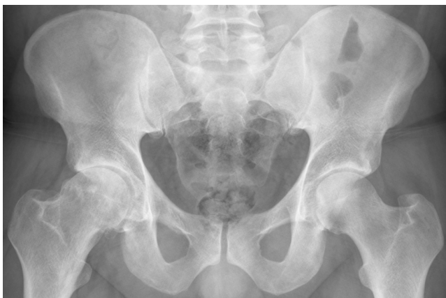
Figura 1. Radiografía simple de cadera A-P: rectificación de la unión cervicocefálica femoral con prominencia ósea o giba.

Ante estos hallazgos se solicita resonancia magnética de cadera en la que se visualiza leve alteración subcondral, con edema óseo en cadera derecha, con irregularidad cortical y leve sinovitis