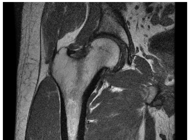
Figura 3. Artrografía: pinzamiento de la interlínea articular antero-superior y posteroinferior, incipiente collar osteofitario femoral con pequeñas lesiones subcondrales antero-superiores de cabeza femoral y pequeños focos de edema en acetábulo anterosuperior. Lesión quística yuxtaarticular en relación con trocánter mayor.

Se remite a unidad de artroscopia del servicio de traumatología para valoración de cirugía artroscópica.