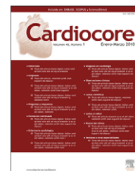
Imagen en Cardiología