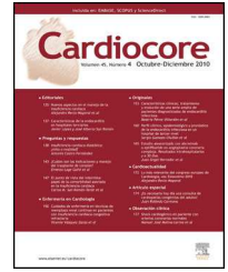
Imagen en Cardiología