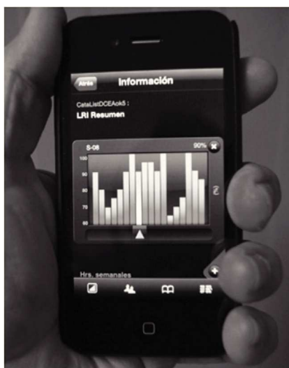
Figura 2. Pantalla de acceso a la consulta interactiva del indicador “práctica docente” desde un iPhone