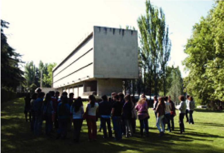
Imagen 3. Experiencia de innovación docente arquitectura-música, asignatura “Teoría y Crítica de la Arquitectura”, visita de profesor y alumnos al edificio de la Casa do Brasil, 2010.