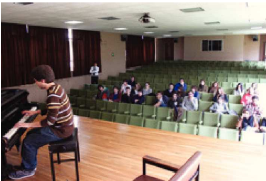
Imagen 4. Experiencia de innovación docente arquitectura-música, asignatura “Teoría y Crítica de la Arquitectura”, interpretación por parte de un alumno de la obra Rumores de la Caleta de Isaac Albéniz, en el edificio de la Casa do Brasil, 2010.

Tercera experiencia. Experiencia músico-arquitectónica en las aulas de la Escuela Politécnica Superior de la uspceu. Asignatura “Composición Arquitectónica”, curso académico 2012-2013.