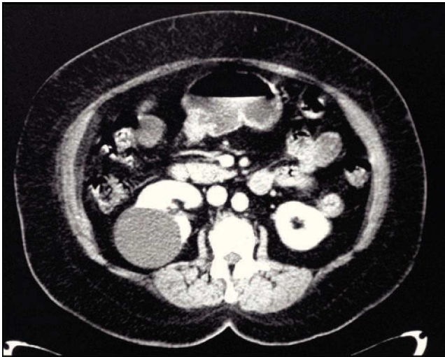
Figura 1 Tomografía abdominal contrastada. Se evidencia imagen hipodensa en cara dorsal de riñón derecho, sin reforzamiento con el medio de contraste.

La elección del paciente para asignarlos a cada grupo fue por conveniencia. Dependiendo de la localización del quiste (ya sea en la cara anterior o posterior del riñón), se divide en 2 grupos: