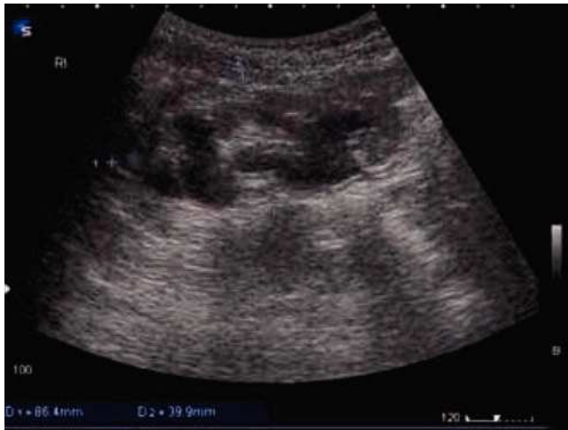
Figura 8 Ectasia renal postquirúrgica residual.

casos revisados, se describe la ampliación vesical con sigmoides más estoma de Mitrofanoff con cateterismo intermitente 9 .