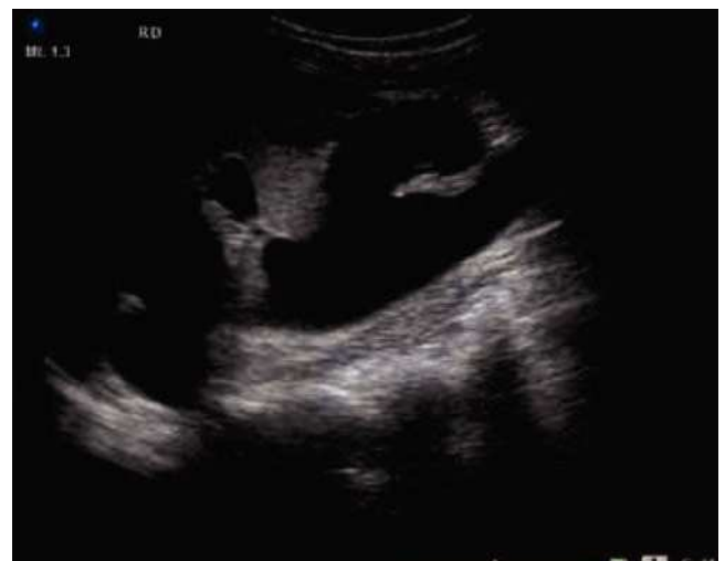
Figura 5 Riñón derecho con ectasia severa.