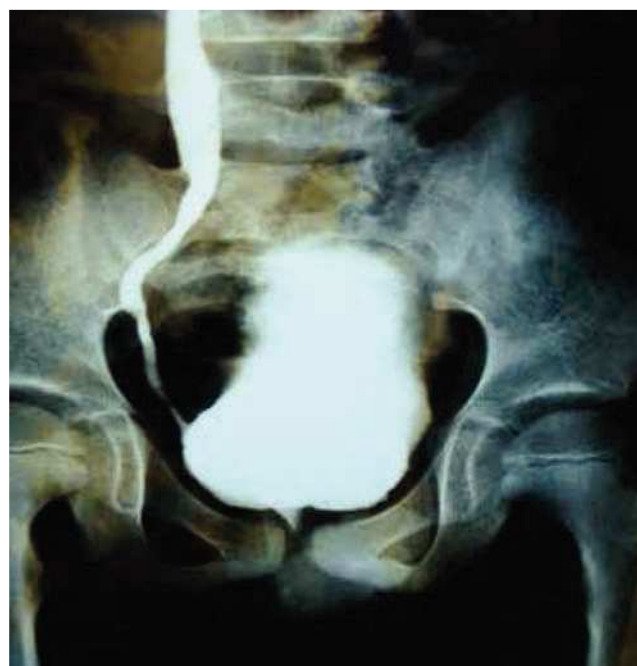
Figura 1 Reflujo vesicoureteral derecho grado V, vejiga en forma de pino.

abundantes, nitritos positivos y proteinuria de 300 mg/dL. Presenta un cultivo positivo para Escherichia coli ( E. coli ) > 100,000 UFC; se indica tratamiento con antibiótico. En la cistografía se evidencia una vejiga de esfuerzo, con reflujo vesicoureteral G-5 derecho y abundante orina residual (fig. 1). El ultrasonido muestra ectasia renal derecha severa y ectasia moderada izquierda (fig. 2). La resonancia magnética de columna se encuentra normal y la valoración por Neurocirugía corrobora que no hay alteración neurológica, la cistoscopia reveló que no hay valvas uretrales. Se realiza ampliación vesical con sigmoides más estoma de Mitrofanoff, se maneja con cateterismo limpio intermitente a través del estoma. En el seguimiento presenta mejoría clínica