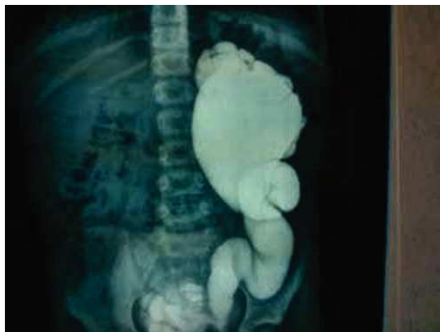
Figura 6 Cistografía con vejiga sumamente trabeculada y reflujo vesicoureteral izquierdo grado V.