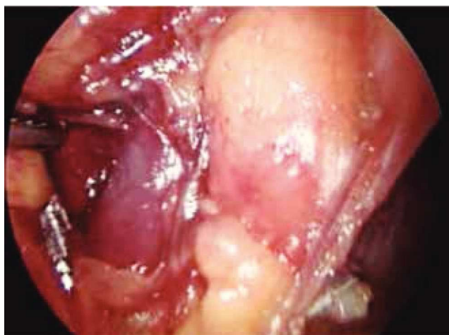
Figura 2 Discección de la vena ilíaca derecha.

vena circunfleja la cual se ligó y se cortó, se localizó el ligamento inguinal en el borde superior, así como el ligamento de Cooper y el tubérculo púbico, retirándose el tejido ganglionar. Una vez hecho esto, se separó la vena ilíaca y se disecó hacia la arteria ilíaca en el sentido postero-inferior, localizándose el nervio obturador, retirando los ganglios de la fosa obturatriz. Al retirar el tejido ganglionar se pudo identificar adecuadamente la vena ilíaca, el nervio obturador y el ligamento inguinal y de Cooper (fig. 3), con lo cual se completó la linfadenectomía pélvica, se realiza mismo procedimiento de lado contralateral y se dejan drenajes cerrados en ambas regiones pélvicas. El paciente presentó una adecuada evolución postoperatoria, dándolo de alta a los 4 días de la cirugía. Reporte histopatológico con 2 ganglios obturadores positivos a metástasis (T2G2NOM0), por lo que se envía adyuvancia para iniciar quimioterapia y radioterapia.