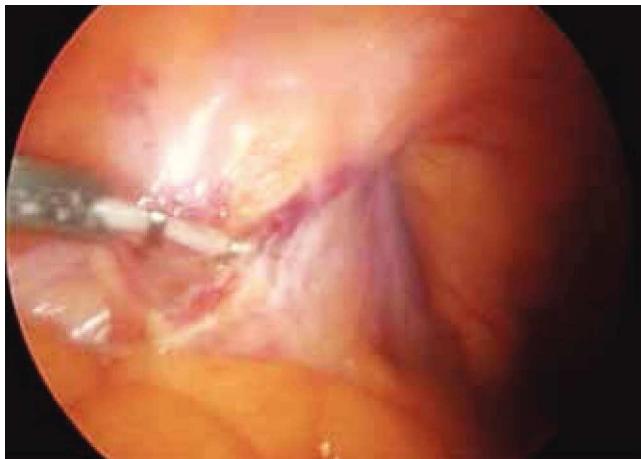
Figura 1 Discección y ligadura del conducto deferente.