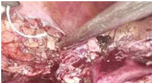
Figura 1 Imagen intraoperatoria durante la reparación primaria.

cuantificada de 600 cc, con una estancia hospitalaria de 5 días; el paciente fue manejado en el postoperatorio con esquema habitual del dolor, con deambulación a las 24 horas, presentó valores de hemoglobina postoperatorios de 9 g/dL, durante el transoperatorio se aplicó un concentrado eritrocitario; el drenaje se retiró a los 4 días, fue egresado a los 6 días, se encuentra en seguimiento por nuestro Servicio con adecuado control.