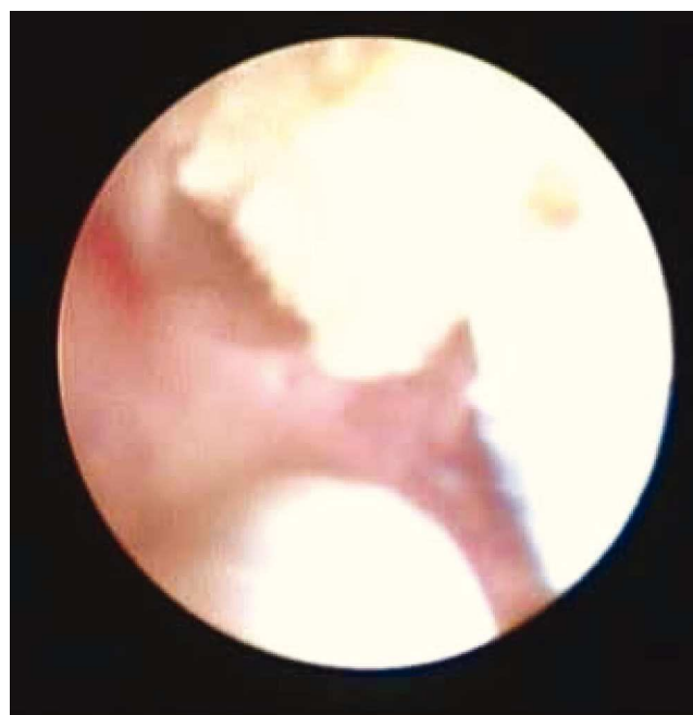
Figura 2 Se introduce catéter de 3 Fr de dispositivo Back-Stop™ para su aplicación.

Por lo tanto, creemos que el BackStop™ es una alternativa eficaz para disminuir la tasa de retropulsión y migración de litos ureterales, además de ser un dispositivo que disminuye el trauma ureteral secundario a su utilización sin interferir en las maniobrabilidad del ureteroscopio y mucho