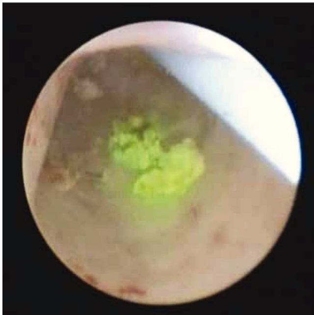
Figura 3 Se observa como los fragmentos son retenidos de manera satisfactoria por el polímero.

menos afectando la visibilidad del mismo. A su vez, no se requieren maniobras complejas para su utilización, lo cual se refleja en el tiempo adicional del procedimiento, teniendo además la ventaja que proporciona sus características de termosensibilidad para la fácil disolución del polímero una vez que ha sido terminada la litotripsia.