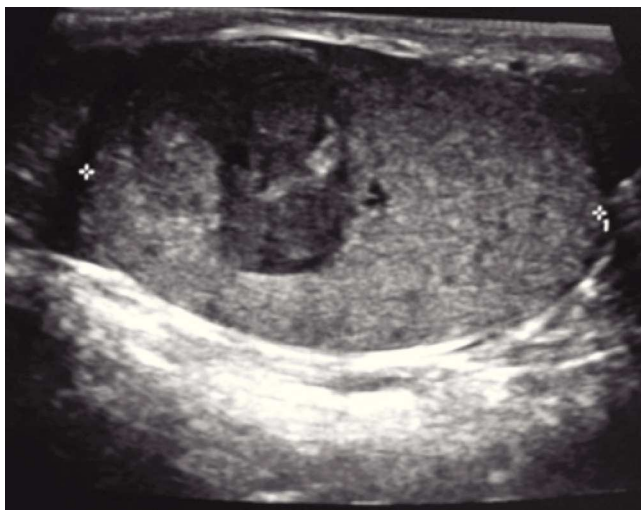
Figura 1 Caso 2. Ultrasonido escrotal que muestra tumoración intratesticular derecha de 1.5 cm de diámetro.