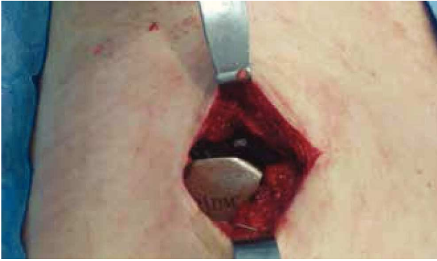
Figura 2 Generador de impulsos (Medtronic InterStim®) colocado en el plano subcutáneo del cuadrante superior externo en el glúteo derecho.

Los diarios de continencia se completaron por 2 semanas más posterior al implante definitivo. Durante el seguimiento observamos que los diarios de hábitos urinario (tabla 1) mejoraron aún más, posterior al implante definitivo. Los episodios de incontinencia prácticamente desaparecieron. No se registraron más síntomas de urgencia urinaria, y la frecuencia diurna y nocturna disminuyó considerablemente. Se solicitó a la paciente completar nuevamente índices de gravedad de síntomas y de calidad de vida de incontinencia urinaria y fecal, 60 días luego de la colocación del implante definitivo. La evaluación de los diarios urinario fue satisfactoria. Presentó disminución significativa en los índices de gravedad de la incontinencia urinaria ( Sandvik Severity Index ), así como en el cuestionario de impacto de la incontinencia urinaria en la calidad de vida (Potenziani). La paciente manifestó notable mejoría en su calidad de vida y presentó mejores puntuaciones en cuanto estilo de vida, conducta y depresión (tablas 2 y 3).