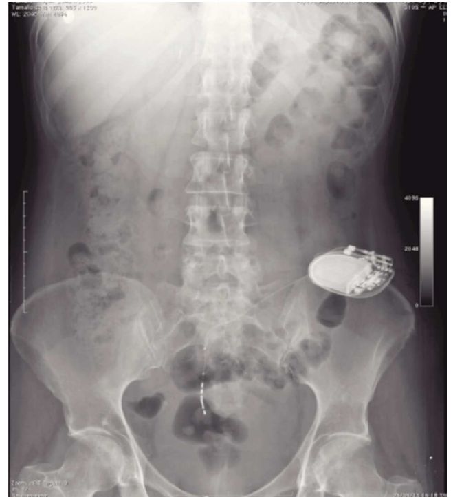
Figura 3 Radiografía simple de abdomen que evidencia la adecuada colocación del implante.

La NRS es beneficiosa en el tratamiento de pacientes con disfunción miccional crónica idiopática que no responde a tratamiento conservador. El manejo de estos pacientes es complejo. Las alternativas terapéuticas para los pacientes retencionistas son: el cateterismo intermitente limpio o la sonda permanente, y en los cuadros de urgencia-frecuencia