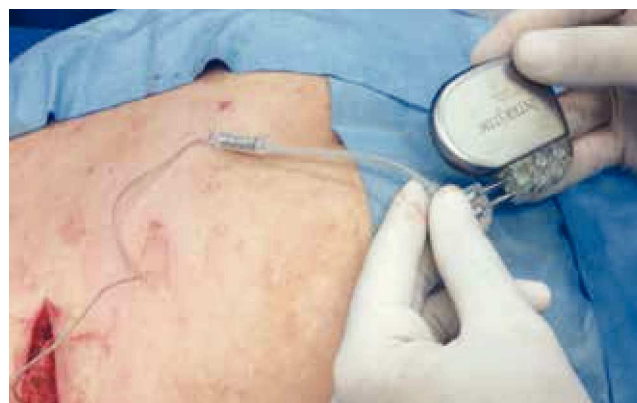
Figura 1 Fase crónica: se implantó en forma definitiva el generador de impulsos.