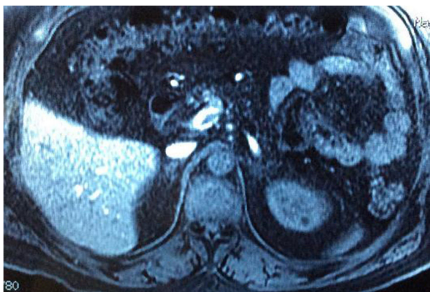
Figura 3 Resonancia magnética sin evidencia de tumoración en ambas suprarrenales, ni metástasis a distancia.