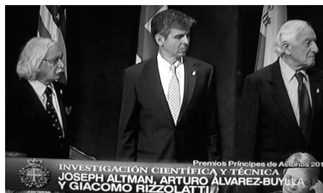
Figura 1 Arturo Álvarez-Buylla durante la ceremonia de entrega de los premios Príncipe de Asturias.

Álvarez-Buylla comparte tan prestigioso galardón con el estadounidense Joseph Altman y el italiano Giacomo Rizzolatti. El Premio a la Investigación Científica y Técnica es concedido a la persona, institución, grupo de personas o de