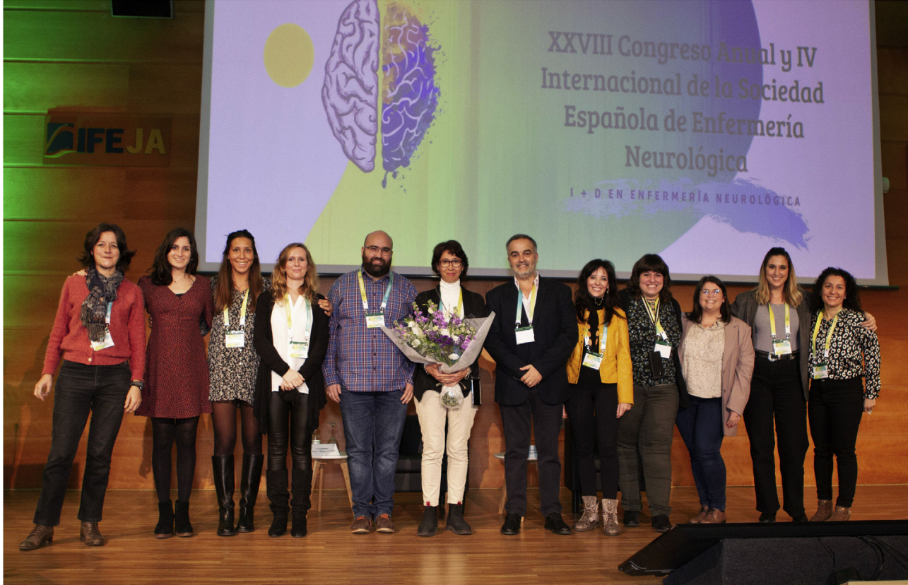
Pie: Junta Directiva de SEDENE.

Desde la Junta Directiva queremos de nuevo agradecer a los ponentes, asistentes y organizadores del congreso. Hasta el año que viene.