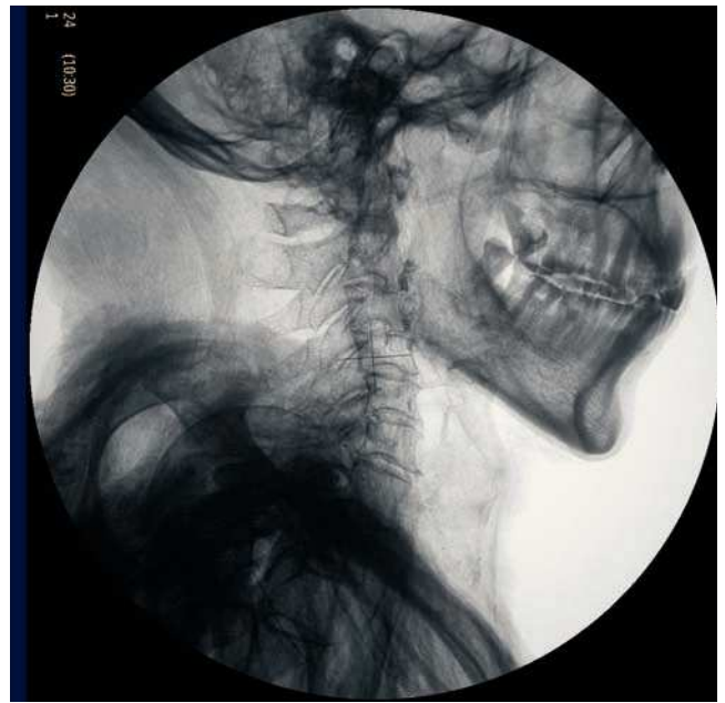
Figura 11 Atrición dental, con desgaste de las coronas, también se aprecia caries en el cordal superior.

opacas, osteocondensantes, que se encuentran en las diáfisis de los huesos largos cerca de las metáfisis, paralelas al cartílago del fémur, del radio y, sobre todo, en la parte distal de la tibia. Estas líneas están provocadas por una aceleración del depósito de nuevo tejido óseo después de una desaceleración del crecimiento 13 .