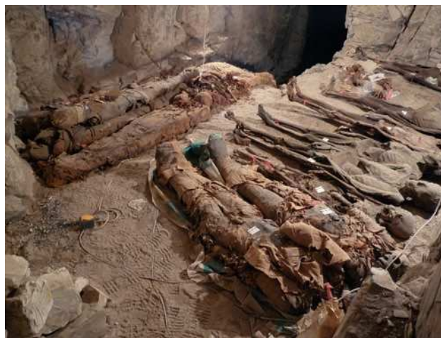
Figura 2 Las 18 momias del Proyecto Monthemhat en la tumba-almacén (TT-04) en El-Asasif.

Las 18 momias del Proyecto Monthemhat fueron encontradas en una pequeña tumba utilizada como almacén en El-Asasif, en la necrópolis Tebana (Luxor), cercana a la gran tumba del