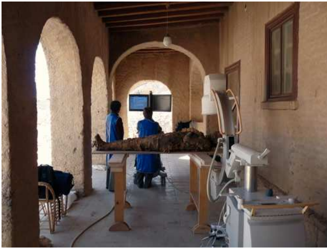
Figura 3 Practicando radiografías en las momias en el porche de "la Casa Americana" en El-Asasif.

de quirófano Philips BV Pulsera. Este equipo está formado por un sistema de brazo en C y por una estación móvil con dos pantallas en las que se visualiza la imagen en tiempo real y ofrece la posibilidad de grabar en CD, en memoria USB e imprimir imágenes en papel.