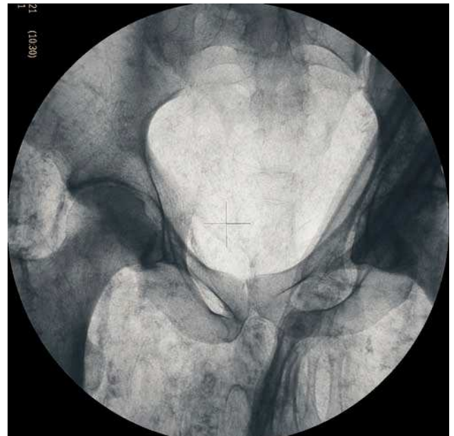
Figura 4 Estudio del sexo, pelvis femenina y pelvis masculina.