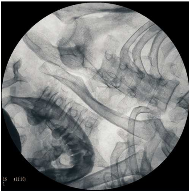
Figura 10 Esqueleto totalmente desarticulado dentro de los vendajes, donde se aprecian dos maxilares.