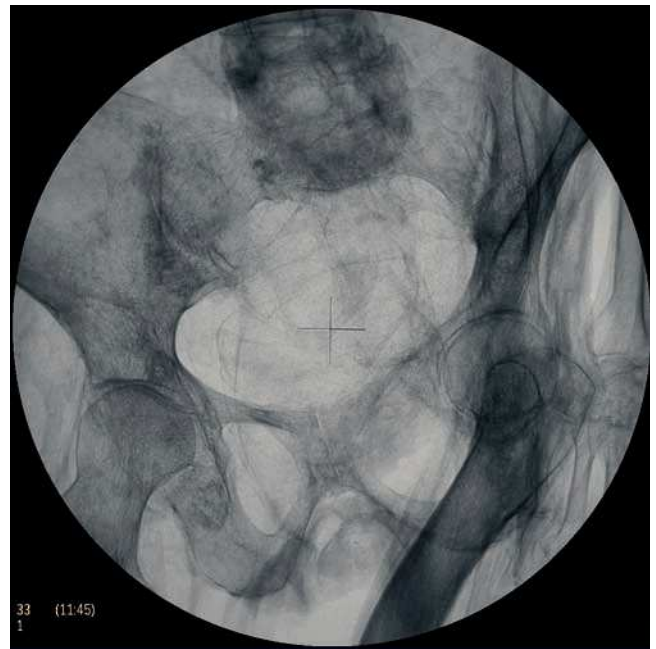
Figura 17 Radiografía de pelvis: asimetría pélvica y fémur en sable en individuo con signos radiológicos de osteomalacia.

La momia número 5 presenta signos claros de osteomalacia, apreciándose esternón en quilla, escoliosis dorso-lumbar, disimetría pélvica y fémur izquierdo en sable (la osteomalacia o raquitismo es una mineralización anómala de la matriz del hueso, provocada por un aporte deficiente de vitamina D, o debido a mala absorción intestinal de esta vitamina o por una alteración renal. Presenta deformidades esqueléticas, como son: piernas arqueadas, proyección del esternón, rosario costal, escoliosis o cifosis, deformidad pélvica y deformidades dentales) 18 (fig. 17).