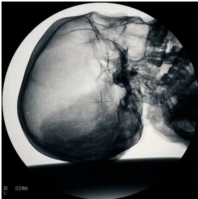
Figura 14 Restos de cerebro en fosa occipital.