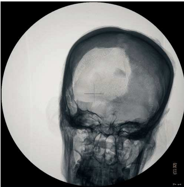
Figura 13 Radiografía de cráneo anteroposterior. Signos de excerebración con fractura de la lamina cribosa y apófisis crista galli. Fractura de la calota craneal por expoliación.