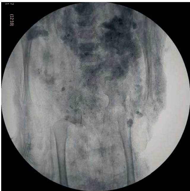
Figura 5 Estudio de la edad. Radiografía de un niño menor de 3 años, en la que se aprecian los cartílagos de crecimiento.

Los dientes son la parte del cuerpo que mejor se conserva después de la muerte. La atrición dental es el desgaste de las coronas dentales debido al movimiento masticatorio. La atrición dental era frecuente en Egipto, debido a la dieta muy rica en vegetales, ya que la celulosa de las plantas provoca desgaste dental y también debido a la harina utili-