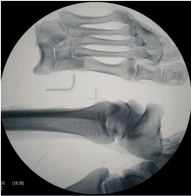
Figura 12 Radiografía de extremidades inferiores: líneas de Harris en el extremo distal de la tibia izquierda apreciándose el pie totalmente desarticulado. Letra L-left de alambre.