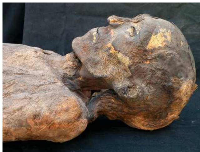
Figura 1 Hombre Dorado. Restos de pan de oro cubriendo el cuerpo momificado.

Básicamente, y resumiendo el proceso, la momificación consiste en vaciar el cuerpo de los órganos, ya que a partir de éstos es donde empieza la putrefacción del cadáver, lo que se llama evisceración . También se extrae el cerebro a través de las fosas nasales, del foramen occipital o de alguna