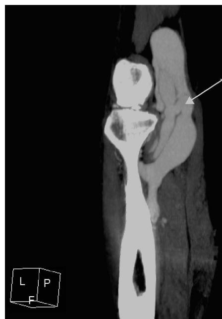
Figura 1 Sección sagital oblicua de tomografía computarizada de miembros inferiores con contraste yodado en fase arterial de región poplítea en la que se observa fístula arteriovenosa poplítea.

Inyección de 100 ml de contraste yodado con bomba inyectora.