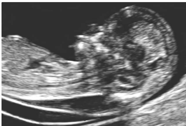
Figura 1 – Imagen ecográfica de un feto de 12 semanas con síndrome de Down, en la que se muestra un aumento de la translucencia nucal.

A principios de la década de 1970, aproximadamente un 5% de las mujeres embarazadas tenía 35 años o más, y en este grupo se encontraba un 30% del total de los fetos con síndrome de Down. Por lo tanto, el cribado basado en la edad materna tenía una tasa de detección (TD) del 30% con 5% de falsos positivos (FP).