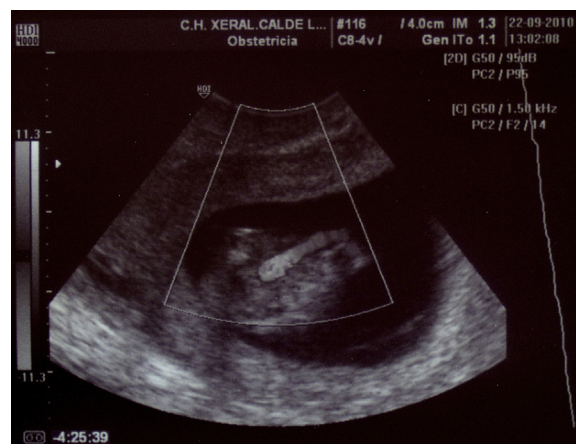
Figura 7 – Ecografía vaginal, caso 2. Con doppler color se pretende demostrar la existencia de una única arteria umbilical funcional.

Foster propuso la primera clasificación de la sirenomelia, utilizando como criterio básico el número de pies. Simelia apus correspondería a aquellos casos que no tienen pies, simelia unipus cuando está presente un pie y simelia dipus si están