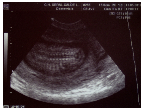
Figura 3 – Ecografía vaginal, caso 1. Interrupción de la columna vertebral a nivel lumbar, no se visualiza sacro.

Se trata de otra madre joven y sana. Es una paciente de 29 años G2P1. No presenta antecedentes personales ni familiares de interés. No es diabética. Niega el consumo de drogas u otros tóxicos. Toma suplementos de ácido fólico y yodo. Acude para la realización de ecografía del primer trimestre según protocolo del centro. Se objetiva la existencia de un embarazo intraútero con feto vivo y longitud cráneo-caudal