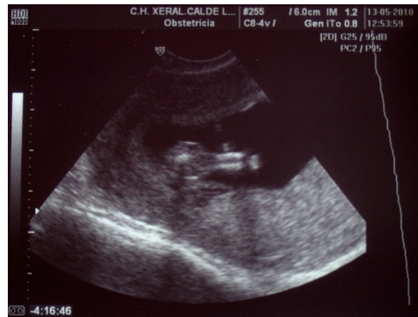
Figura 2 – Ecografía vaginal, caso 1. La pantorrilla del feto contiene 2 tibias fusionadas.

posición medial con presencia de un único pie de 3 dedos (figs. 4 y 5). Ausencia de genitales externos (se aprecian 2 testículos intraabdominales). Atresia ano-rectal. Malformación del sacro, del segmento inferior medular y de la cola de caballo. Ausencia de vejiga y agenesia renal bilateral (sí se pueden identificar ambas suprarrenales). No malformaciones en la mitad superior del cuerpo. Cordón umbilical con 3 vasos sanguíneos (2 arterias y una vena). Se cita un peso fetal de 33 g y una longitud corona-cóccix de 7 cm. Longitud de pie 0,8 cm. Perímetro cefálico de 8,5 cm, de tórax 7,5 cm y de abdomen 7 cm.