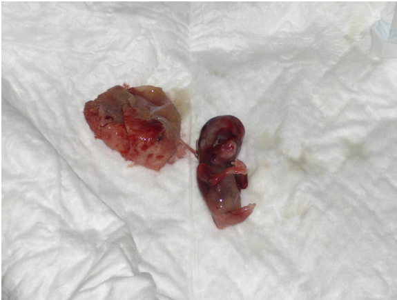
Figura 8 – Fotografía del feto perteneciente al caso 2, con extremidades inferiores fusionadas.

presentes 2 pies 9 . Otra clasificación es la de Stocker y Heifetz 1 que se basa en la presencia o ausencia de los huesos de la extremidad inferior. Citan 7 tipos. El tipo uno corresponde a los casos con huesos de muslo y pierna presentes, hasta el tipo 7 con fémur único y tibia ausente.