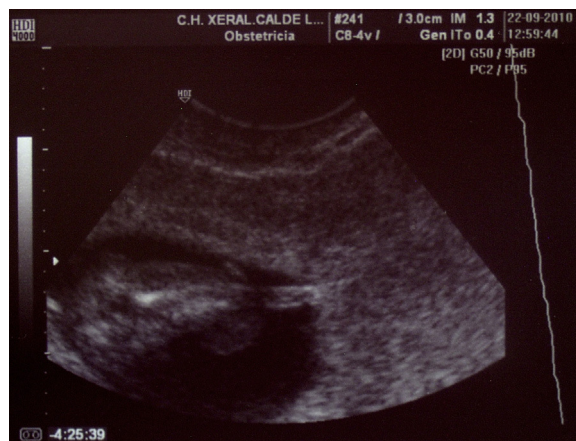
Figura 6 – Ecografía vaginal, caso 2. La pantorrilla fetal aparece acortada con un pequeño muñón distal que remeda un pie.

fusionadas (figs. 8 y 9), hipoplasia de genitales externos, atresia de colon, imperforación anal, malformación del sacro y del segmento inferior medular, ausencia de vejiga y agenesia renal bilateral, ausencia de bazo, testículos intraabdominales, cordón umbilical con 3 estructuras vasculares (2 arterias y una vena), no malformaciones en la mitad superior del cuerpo. En la mitad inferior del feto existe una única extremidad que sale del centro de la pelvis terminada en un pequeño apéndice de 4 mm. Se informa de longitud corona-cóccix de 7 cm, perímetro craneal de 7 cm, perímetro torácico de 6 cm, perímetro abdominal de 6 cm.