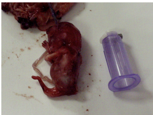
Figura 5 – Fotografía fetal del caso 1, espécimen con sirenomelia.

El informe anatomopatológico hace referencia a sirenomelia en un feto varón de 20 g de peso. Extremidades inferiores