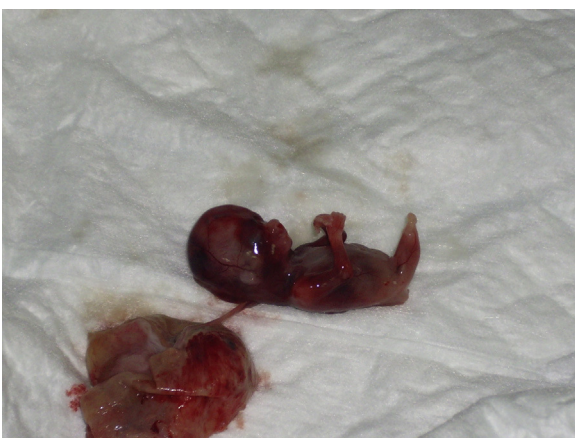
Figura 9 – Fotografía fetal del caso 2, espécimen con sirenomelia.

Existen varias teorías que pretenden explicar la embriología de la sirenomelia. La primera es relativa a un defecto en la blastogénesis al final de la tercera semana. Una noxa afectaría al desarrollo de la línea media durante el periodo de gastrulación en la eminencia caudal y, con ello, al tejido mesodérmico que da origen a las extremidades inferiores 15 . La segunda teoría etiopatogénica está relacionada con anomalías vasculares. Así, se ha demostrado por arteriografía la persistencia de una