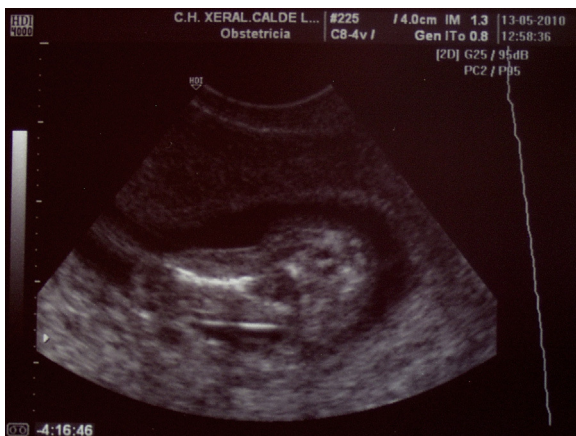
Figura 1 – Ecografía vaginal, caso 1. Se visualiza una única extremidad inferior, con un fémur en posición central con respecto a la pelvis fetal.

El estudio anatomopatológico confirma el diagnóstico ecográfico. Ven las extremidades inferiores fusionadas y en