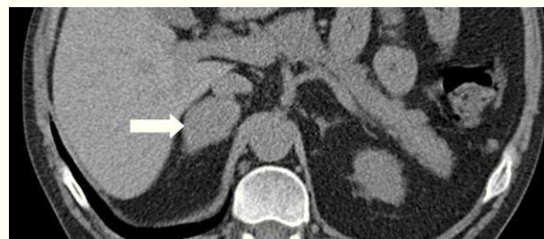
Figura 1 TC toracoabdominal que muestra un nódulo suprarrenal derecho de 4 cm de diámetro, de contorno liso y regular, con contenido homogéneo, vascularizado y con atenuación de 25 UH basal y 74 UH tras contraste.

Se trata de un varón de 38 años con el único antecedente de hipertensión arterial de 2 años de evolución, bien controlada con enalapril, que consultó por primera vez en nuestro centro en noviembre de 2010. Aproximadamente 2 años antes y a causa de una infección por varicela se realizó una tomografía computarizada (TC) en la que se objetivaron signos de osteoporosis severa, confirmada posteriormente mediante una densitometría ósea. En consulta de Reumatología se detectó cortisol libre urinario (CLU) elevado y fue remitido a Endocrinología para estudio. Clínicamente refería acúmulo de grasa abdominal, estrías rojo-vinosas en abdomen, muslos y axilas, debilidad de la musculatura proximal, fragilidad capilar y artromialgias generalizadas de 5 años de evolución. Se realizó un estudio funcional del eje hipofiso-adrenal que mostró los siguientes resultados: cortisol plasmático a las 8 y 23 h de 27 y 23 \mu\text{g}/\text{dl} respectivamente, CLU de 160 y 167 \mu\text{g}/24\text{h} en 2 d consecutivos, ACTH (8 h) de 46 y 43 \text{pg}/\text{ml} en 2 d consecutivos (VN 9-55) y CLU tras supresión fuerte con dexametasona (2 mg cada 6 h durante 2 d) de 193 \mu\text{g}/24\text{h} . Una resonancia magnética hipofisaria no mostró hallazgos patológicos