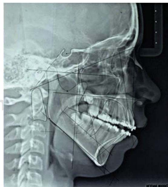
Figura 10. Trazado cefalométrico final de McLaughlin.

Se obtuvo sellado labial, mejor proyección del labio superior, una sonrisa agradable, armonía facial, clase II molar funcional y clase I canina, sobre mordida horizontal adecuada (Figuras 8 y 9), los cambios cefalométricos obtenidos fueron en el campo dental, ob-