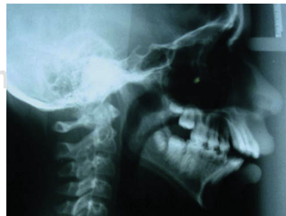
Figura 4. Radiografía lateral de cráneo.

A la exploración intraoral, se observó mordida abierta anterior de canino a canino, línea media inferior desviada con respecto a la superior 3 mm a la derecha, overjet 4 mm y overbite -1 mm, relación molar