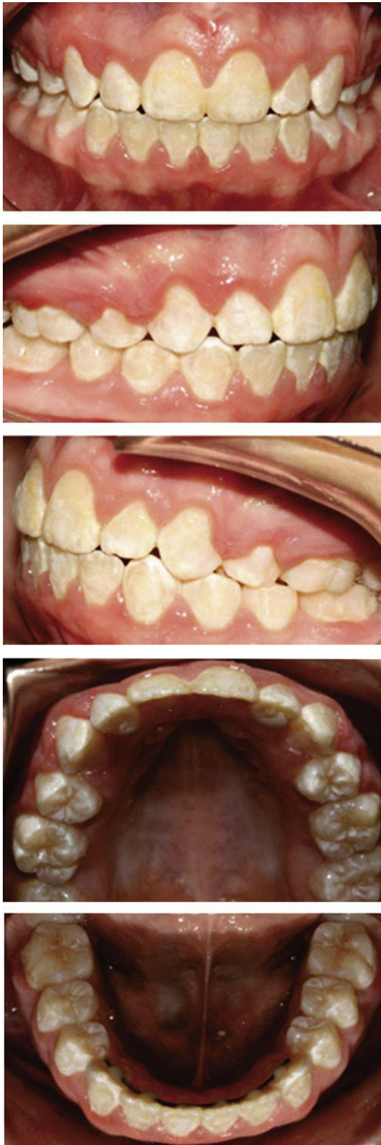
Figura 9. Fotografías intraorales finales del tratamiento.

premolares superiores solamente, se colocó la aparatología superior, se llevó a cabo la fase de alineación y nivelación con la secuencia de arcos propia de la técnica.