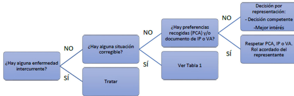
Figura 2 Negativa a la ingesta en paciente con DA. DA: demencia avanzada.

particular y solo el 3% se mostró favorable a la NE por sonda a largo plazo 25 .