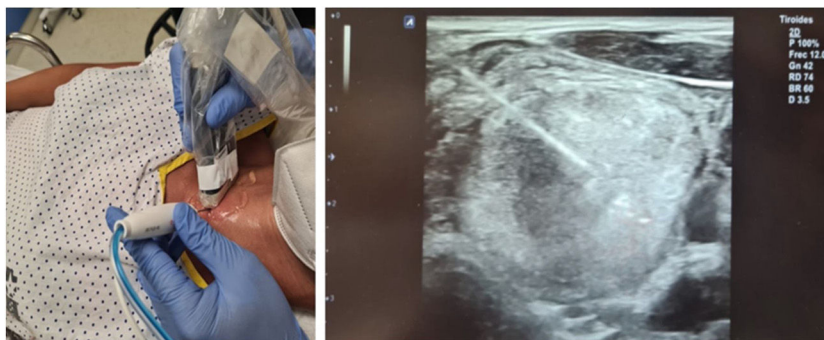
Figura 1 Técnica para el tratamiento por ablación con radiofrecuencia de nódulos tiroideos benignos. Introducción del electrodo por un abordaje transístmico y ablación mediante la técnica de «Moving shot».

acceso más favorable y, con control ecográfico, se introducía anestesia (lidocaína al 2%) pericapsular y en tejido celular subcutáneo del sitio de punción (momento en el que se considera iniciado el procedimiento). Posteriormente se insertaba un electrodo monopolar, autorefrigerable, de 19G, 7 cm de largo y con una punta recta activa de 1 cm (STAR TIR RF 19-07s10f.), conectado a un generador de radiofrecuencia (Cool-tip VIVA RFSsystem, StardMed) del que se originaba una corriente eléctrica alterna (pudiendo utilizar de 0–200 W de potencia, con una carga de salida máxima de 50 \Omega ), y simultáneamente a una bomba peristáltica de refrigerado. Una vez introducido el electrodo por un abordaje transístmico, este era desplazado por el interior de NT para ser tratado, utilizando la técnica de «Moving shot» 26 , hasta completar la ablación (fig. 1).