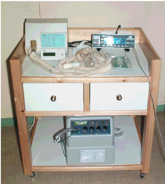
Figura 1. Carrito para transportar uno o 2 respiradores para administrar VMNI itinerante por las plantas de hospitalización, además de mascarillas o material para fabricarlas, cánulas traqueales, etc. (Cortesía Prof. Juan Fernando Masa, Hospital San Pedro de Alcántara de Cáceres.)

rización. Con el paso del tiempo se incorporó la pulsioximetría y un carrito para transportar uno o 2 respiradores para administrar VMNI itinerante por las plantas de hospitalización, además de mascarillas o material para fabricarlas, cánulas traqueales, etc. (fig. 1). A partir de 1999 se empezó a tratar a pacientes más agudos. En primer lugar, las exacerbaciones de enfermedad pulmonar obstructiva crónica y, en segundo lugar, a los obesos con insuficiencia cardíaca congestiva, con el objetivo de evitar su ingreso en UCI. Gracias a esta labor se consiguió habilitar 2 habitaciones con 2 camas cada una, específicas para la administración de estas terapias. Este «primordio» de UCRI contaba con oximetría y con un refuerzo de enfermería durante la mañana y, a partir de ese momento, se comenzó a recibir a pacientes de UCI para continuar la progresión respiratoria. Todo esto sin guardias de neumología, de tal forma que cuidados intensivos se encargaba del cuidado de los pacientes en los turnos de tarde y noche.