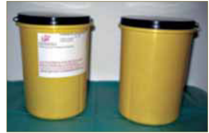
Fig. 6. Contenedores de residuos sanitarios

El almacenamiento es más aconsejable realizarlo en contenedores pequeños, y sustituirlos cada dos o tres meses en nuestras consultas, que en contenedores grandes y cambiarlos cada año (NTP-853, 2010).