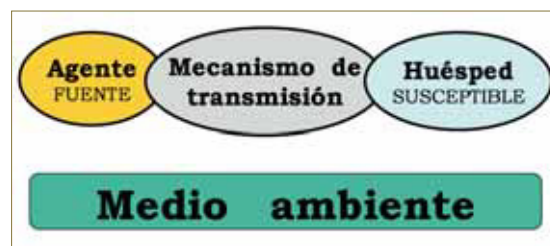
Fig. 1. Cadena de transmisión de las infecciones

incrementará la contaminación ambiental y elevará la posibilidad de transmisión. Que el resultado final sea una enfermedad o no, dependerá de la patogenicidad y virulencia del microorganismo, de la dosis y de las defensas del huésped (NTP-700, 2006).