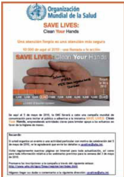
Fig. 4. Save Lives: Clean your Hands.

La Organización Mundial de la Salud (OMS) considera la higiene de las manos como principal medida para reducir las infecciones asociadas a la atención sanitaria. Recomienda que se realice el lavado de manos al comenzar y terminar la consulta, cuando la actuación implique un contacto directo, haya una exposición a líquidos corporales, así como antes y después del uso de guantes estériles y entre paciente y paciente. Para ello se utilizan las soluciones hidroalcohólicas (las más efectivas para reducir la contaminación bacteriana de las manos y tiene escasos efectos secundarios), lavado con agua y jabón y “el lavado social” (OMS, 2010) (Palacio et al, 2010).