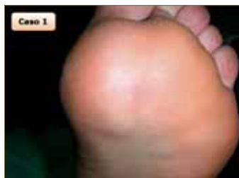
Figura 18: Sexta sesión. La continuidad de los dermatoglifos muestra la ausencia de la lesión