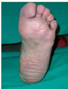
Figura 28: La óptima evolución del proceso culmina con la desaparición de la verruga plantar.