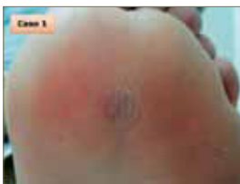
Figura 17: Quinta sesión. La verruga está prácticamente erradicada.