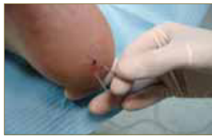
Figura 10: Reactivación energética mediante el giro de la aguja.

Cada sesión tiene una duración de 20 minutos, y a la mitad de ésta realizaremos lo que se conoce como Reactivación Energética. Este proceso consiste en girar las