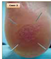
Figura 19: Primera sesión. En el inicio del tratamiento optamos por 4 agujas en forma de aspas.

Se trata de una lesión amplia e ilimitada. Aunque inicialmente decidimos aplicar 4 agujas con forma de aspas, en la segunda sesión nos replanteamos el número debido al tamaño de la lesión, en este caso con cinco, pero siempre alternado su disposición al colocarlas. Evolucionó favorablemente al disminuir su extensión y disminuir el número de papilas (Fig. 19 – 24).