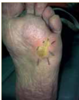
Figura 27: Se aplican sólo 6 agujas tras la mejoría del cuadro.