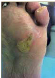
Figura 26: Se ha reducido la extensión y grosor de la lesión.