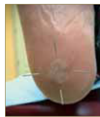
Figura 7: Disposición de las agujas en cruz latina.

El número de agujas variará en función del tamaño de la lesión, manteniendo siempre un mínimo de 4 agujas y hasta un máximo de 8. En caso de que coloquemos 4 agujas las aplicaremos con forma de cruz latina (+) o de aspas (x), alternándola entre una sesión y otra (Fig. 7 y 8).