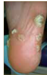
Figura 12: Aspecto de las lesiones tras la aplicación de formol oficial al 40% (fórmula magistral).