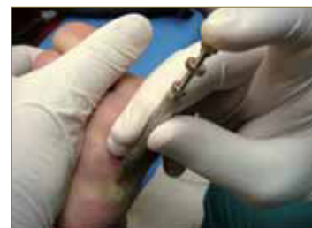
Figura 6: Angulo de incidencia del aplicador de 45° sobre zona de punción.

El número de agujas variará en función del tamaño de la lesión, manteniendo siempre un mínimo de 4 agujas y hasta un máximo de 8. En caso de que coloquemos 4 agujas las aplicaremos con forma de cruz latina (+) o de aspas (x), alternándola entre una sesión y otra (Fig. 7 y 8).