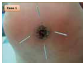
Figura 16: Tercera sesión. La lesión se encuentra bien definida.

Se trata de una lesión de mediano tamaño, bien localizada y delimitada, por lo que decidimos colocar 4 agujas en forma de cruz latina. Remitió en la sexta sesión (Fig. 16 – 18).