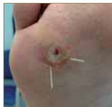
Figura 13: Verruga plantar de evolución tórpida.