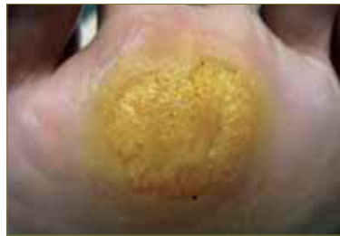
Figura 11: Verruga plantar tratada con ácido nítrico.