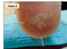
Figura 22: Cuarta sesión. Se observa cómo se agrupan las papilas.