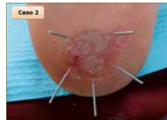
Figura 20: Segunda sesión. Nos decantamos por aplicar una aguja más para aumentar la zona de acción del tratamiento.