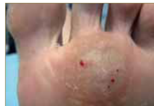
Figura 14: Lesión en mosaico de larga evolución.