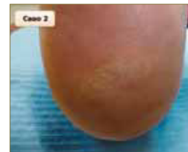
Figura 24: Sexta sesión. En el final del primer ciclo se aprecia la reducción de las dimensiones de la verruga así como el cambio de su morfología, en comparación con el inicio.