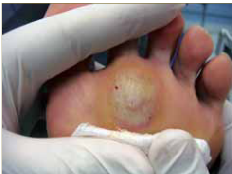
Figura 1: Papilas características de la verruga plantar.

Este tipo de lesiones presentan una clínica característica dada por la morfología de la verruga. Suelen presentar un tejido hiperqueratósico en la superficie (debemos proceder a realizar una diagnóstico diferencial con el heloma), así como un punteado negruzco, de fácil sangrado frente a la deslaminación que se corresponde con la anastomosis arteriovenosa provocada por el VPH (Fig. 1).