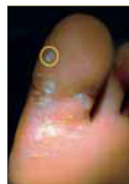
Figura 5: Las agujas deben ser dispuestas en la periferia de la lesión.

La colocación de las agujas deberá ser perilesional, a 2-3 mm de los bordes de la lesión, con una angulación de 45° respecto a la piel (Fig. 5 y 6).