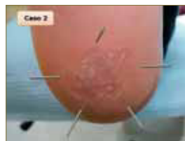
Figura 21: Tercera sesión. Se aprecia la disminución del tamaño de la lesión.