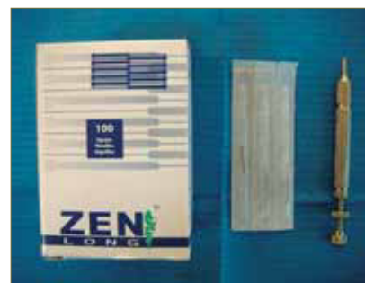
Figura 4: Aplicador y agujas de acupuntura utilizadas en esta técnica.

que, mediante su giro, determina la profundidad de la aguja que va a penetrar la epidermis.