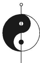
Figura 3: Símbolo que representa las características del YIN y el YANG.

El YANG significa actividad y representa lo positivo. Se asocia al color rojo, al día, a la claridad, a lo cálido, al verano, a lo sutil, a lo ilimitado, al miembro superior y a la mano.