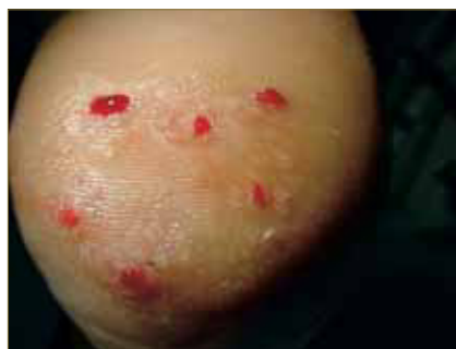
Figura 2: Verruga plantar en mosaico que abarca casi la totalidad de la cara plantar del talón.

Se trata de verrugas proliferativas, emergiendo más hacia la superficie, no son tan profundas como las plantares (Fig. 2). Suele existir una lesión más grande considerable como la principal. La transmisión inicial es infiltrante por VPH; en un segundo estadio se produce por vía linfática o por autoinoculación (a través de lavado, roces, presiones). En individuos inmunodeprimidos la posibilidad de desarrollar estas verrugas es más alta. Suelen presentar resistencia a varios tratamientos, por lo que suelen ser recidivantes.