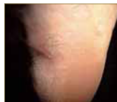
Figura 15: Numerosas verrugas plantares cronicadas.