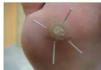
Figura 8: Disposición de las agujas en forma de aspas.

Es recomendable que, cuando coloquemos las agujas, presionemos el pulsor del aplicador de forma rápida y precisa, para evitar que la aplicación resulte dolorosa para el paciente (Fig. 9).