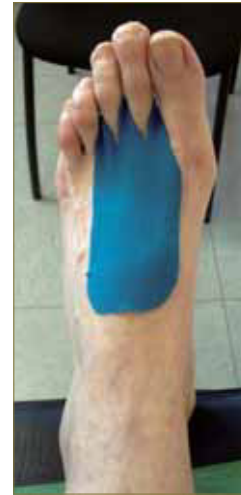
Fig. nº 4: VNM aplicado para metatarsalgias.

En el caso de nuestra paciente, diseñándose varios modelos de VNM, como se indica en la tabla 2. Se obtuvo una gran mejora de la zona inflamada, logrando mayor éxito en el tratamiento de la fascitis plantar.