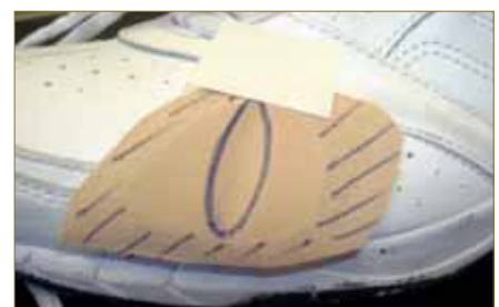
Fig. 5: Protector de lunasoft® que posteriormente iría fijado en el interior del calzado.

Realizamos uno para la región dorso medial de la primera cabeza metatarsiana del pie derecho y otro para la región dorso lateral del quinto metatarsiano del pie izquierdo.