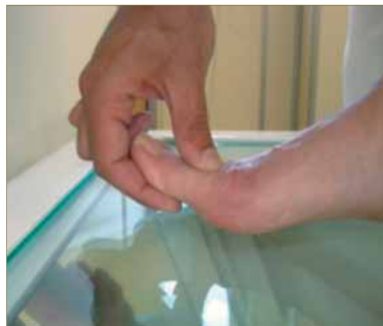
Fig. 1: Test de Hubshire.

una limitación de la flexión dorsal de la tibio-peroneo-astragalina TPA bilateral, limitación de los rangos articulares de la articulación subastragalina ASA bilateral, así como un hallux abductus valgus HAV incipiente bilateral, obteniéndose positivo a test de Hubshire 15 (fig. 1). En la exploración muscular por grupos se aprecia una hipotonía de la musculatura de PI, normoreflexia rotuliana y aquilea.