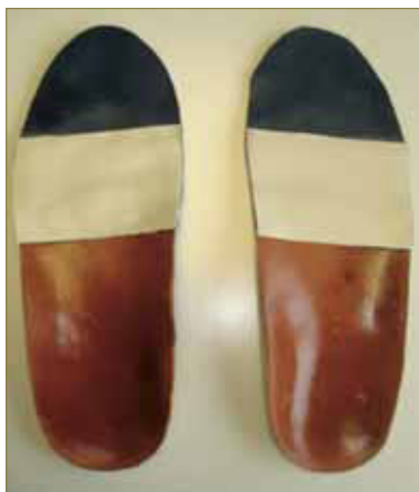
Fig.3: Imagen de los soportes plantares confeccionados.

En el momento de la confección de nuestro soporte plantar para nuestra paciente se escogió el modelo biomecánico. Descartando los tratamientos posturales por la presencia de enfermedad neurológica, al verse afectado el SNC no obtendríamos respuesta favorable al mismo o ésta sería muy pobre, dando así prioridad, a los tratamientos biomecánicos ya que el objetivo se centra en mejorar la marcha, compensando el exceso pronatorio a nivel de la articulación mediotarsiana, manteniendo así la fascia plantar con el propósito de relajarla, mejorando el proceso agudo inflamatorio. Se confeccionan unos soportes plantares con resinas termofusionables flex 1.9 mm., flux 1.2 mm. y elemento anterior de Memory® y forro de piel sintética (Fig. 3). En futuros controles de calidad hay una aplicación de un elemento balancín de corcho sintético de 3mm y un refuerzo postero- interno de Lunacell® 8mm. bilateral. En el estudio de la dinámica calzada portando los soportes plantares, observamos un aumento de la velocidad, una disminución de la pronación y una marcha más estable y armónica.