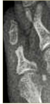
Figura 11. Hemifalangectomía de la falange media.

santes del heloma y segundo para prevenir la recidiva, ya que al reseca la cabeza de la falange proximal, el espacio ocupado por esta, será ocupado por le falange media y/o distal con el riesgo de volver a recidibar, solo se evita si la falange media en su aspecto lateral está plana y no protruye. (Figura 11)