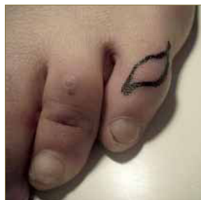
Figura 7. Plastia cutánea descrita por Bonnie J. Nicklas

La descrita por Nicklas BJ consiste en hacer dos incisiones semielípticas, casi paralelas al eje rotador del dedo, con el cabo distal medial el cabo proximal lateral siempre manteniendo la proporción de tres de longitud por uno de anchura para facilitar el cierre de la herida. (Figura 7)