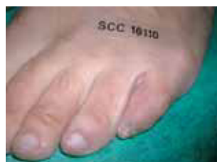
Figura 4. Desviación del 5º dedo en adducto-varo.