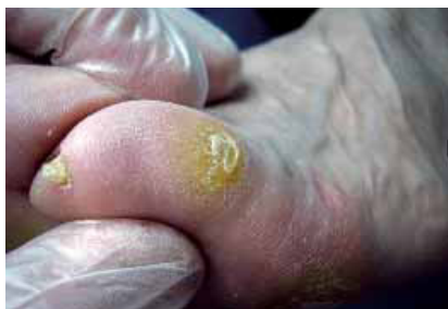
Figura 1. Heloma dorsolateral de 5º dedo.

Si bien es cierto que en ocasiones es fácil establecer una diferencia precisa entre ambas patologías, también hay casos en los que existe una FD de la AMTF sin que se trate de un quinto dedo supraductus.