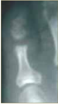
Figura 9. Artroplastia a nivel de cuello anatómico.