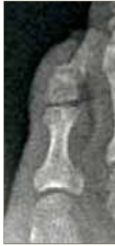
Figura 10. Regeneración de hueso a los 12 años.