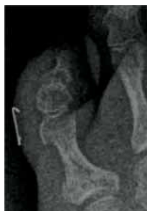
Figura 2. Testigo radiopaco.

La incorporación a nuestro trabajo de la radiología digital, nos ha permitido la observación de una mayor presencia dedos bifalángicos prequirúrgicamente (Figura 3)