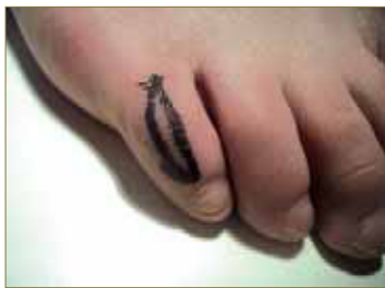
Figura 6. Plastia cutánea descrita por O.A. Mercado.

Una descrita por el Dr. A.O. Mercado, consistente en hacer una incisión lineal en el centro del dedo y otra semielíptica lateral a la primera. (Figura 6)