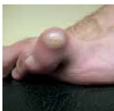
Figura 5. Desviación del dedo en el plano sagital.