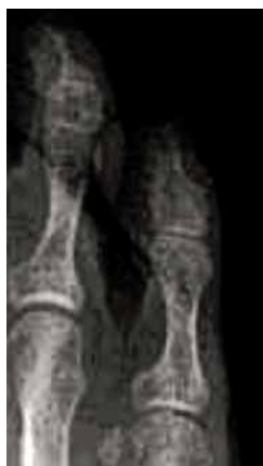
Figura 3. Dedo bifalángico.

También nos puede servir de ayuda la toma de dos fotografías del dedo afecto con el pie en carga, una frontal y otra lateral, para poder establecer una clasificación y un diagnóstico con exactitud que nos conduzca al procedimiento quirúrgico de elección.