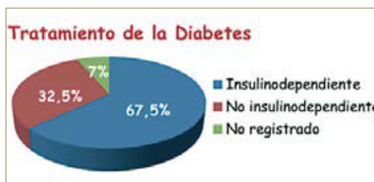
Gráfico 2. Tratamiento de la Diabetes.

Un 67,5% de los diabéticos es insulino dependiente y un 32,5% es no insulino dependiente; en un 7% de los pacientes diabéticos no se refleja esta variable. Gráfico 2.