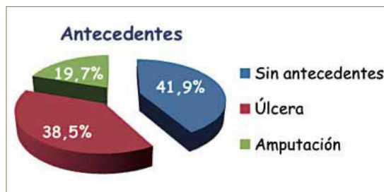
Gráfico 1. Antecedentes de la muestra.

Considerando antecedentes como úlceras y/o amputación previa. El 41,9% no presenta antecedentes, el 38,5% refiere úlcera previa y el 19,7% refiere episodio de amputación previa en las extremidades inferiores (en adelante, EEII). Gráfico 1.