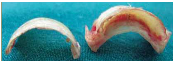
Figura 5. Láminas ungueales avulsionadas.

Una vez producida la exéresis de estas láminas el dolor y la inflamación va recurriendo de forma rápida y vuelve a crecer con total normalidad una nueva lámina ungueal. Las recidivas tras el tratamiento son muy poco frecuentes.