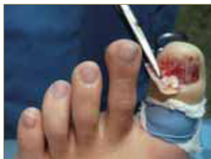
Figura 3. Avulsión lámina ungueal.

La avulsión de la lámina ungueal y/o láminas ungueales subyacentes es el tratamiento de elección para resolver la retroniquia 2, 3, 4, 5, 6, 9, 10 . (Figura. 3, 4 y 5).