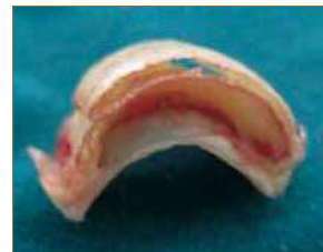
Figura 4. Lámina avulsionada.