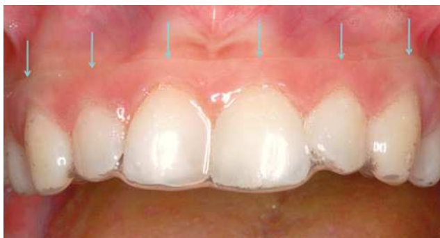
Figura 3. El borde de la férula portamedicamentos se sitúa a una distancia de aproximadamente 3-4 mm por encima del margen gingival (véase las flechas) para aproximar el gel de clorhexidina a la zona de las bolsas. El gel sobrante se elimina con agua una vez colocada la férula para impedir la deglución de cantidades importantes de producto. Una vez retirada la férula se han de hacer enjuagues con agua. Además, se recomienda limpiar la férula y los dientes con un cepillo dental.