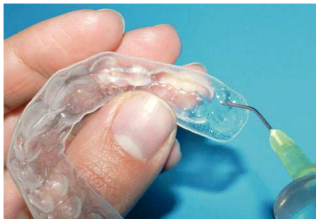
Figura 4. El paciente rellena la férula en su domicilio aplicando una banda fina de gel de clorhexidina al 2% a la altura del margen gingival sirviéndose de una aguja roma. El odontólogo o un técnico en profilaxis instruyen al paciente en la consulta acerca del procedimiento para llenar la férula.

Los higienistas de la consulta enseñan a los pacientes el manejo de estas férulas portadoras de medicamentos y les entregan además unas instrucciones de uso. Los pacientes se deben colocar la férula a partir de la última visita del tratamiento inicial hasta 2 semanas después del raspaje profundo cada noche durante 15-30 min. Al término del raspaje profundo el odontólogo aplica gel de clorhexidina al 2% con una aguja roma en las bolsas y coloca la férula. Se le explica al paciente que la ha de llevar durante una hora. A partir de la segunda semana después del raspaje profundo se recomienda otro período de uso cada 3 días durante 6-8 semanas (hasta la nueva cita de revisión). Se utiliza una jeringa y una aguja roma