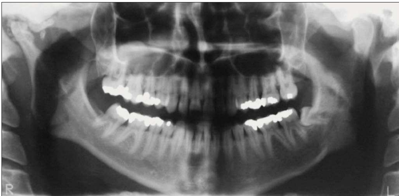
Figura 1. Radiografía panorámica.

tató una calcificación de mayor tamaño directamente encima del cóndilo. Al mismo tiempo llama la atención un ensanchamiento marcado de la base craneal (fig. 4). Este hallazgo sugiere una posible etiología inflamatoria de las calcificaciones. En pacientes muy jóvenes hay que tener presente la posibilidad de una artritis reumatoide, si bien en el caso que nos ocupa la ausencia de sintomatología clínica iría en contra de este diagnóstico. La falta de síntomas es más bien una característica de la condromatosis sinovial. Esta enfermedad rara que se acompaña de la formación de encondromas aislados, los cuales se calcifican posteriormente, no suele provocar dolor en la articulación temporomandibular hasta fases avanzadas. Es posible observar encondromas libres en el espacio articular. En estos casos hay que hacer el diagnóstico diferencial con una osteocondrosis disecante (OCD).