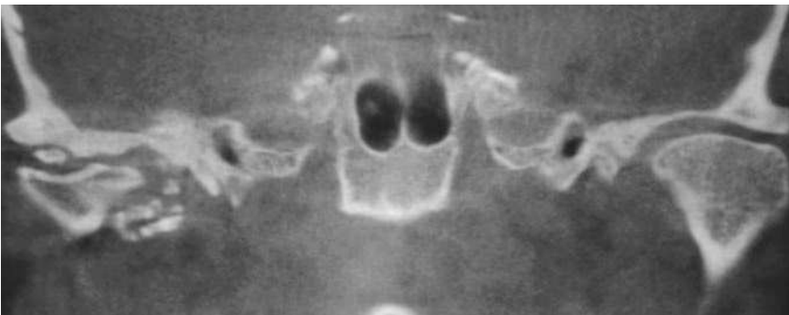
Figura 4. Tomografía volumétrica digital dental: plano coronal. Obsérvese la anchura de la base craneal en comparación con el lado contralateral.