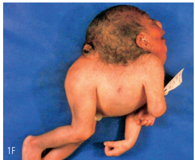
Figura F: Iniencefalia apertus.