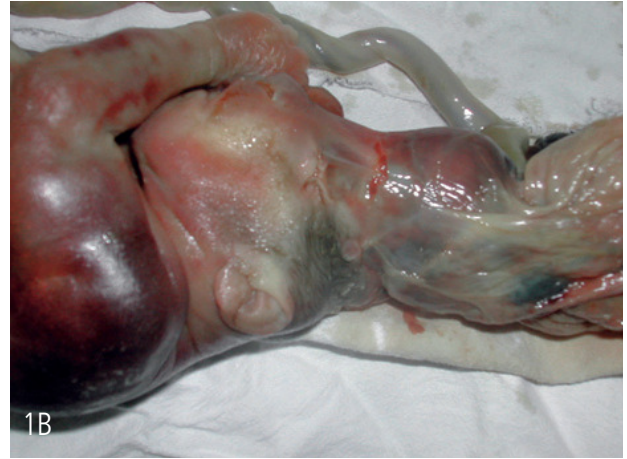
Figura B: Cefalocele y acrania por bridas amnióticas.