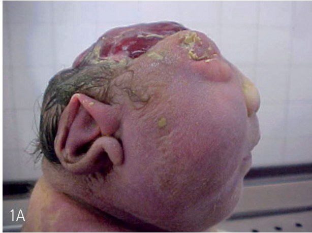
Figura A: Anencefalia.