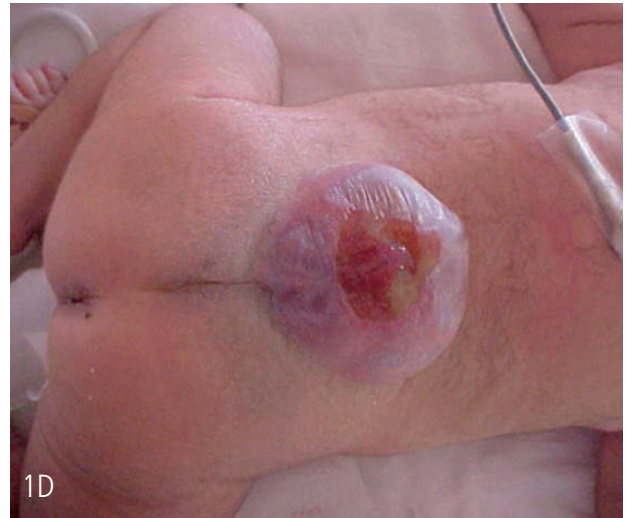
Figura D: Mielomeningocele.