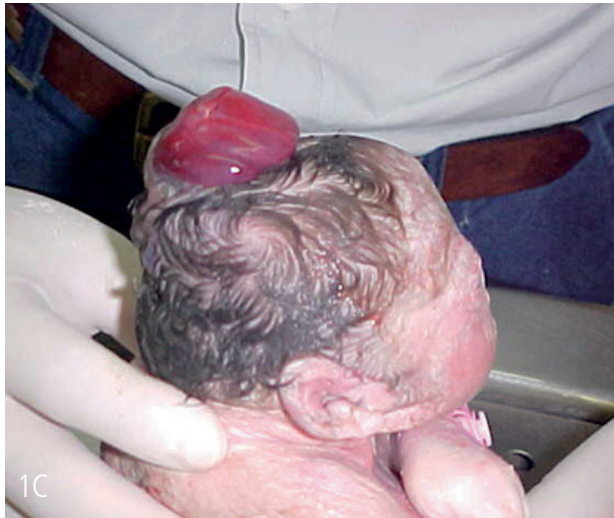
Figura C: Cefalocele.