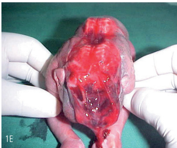
Figura E: Cráneo-Raquisquisis.