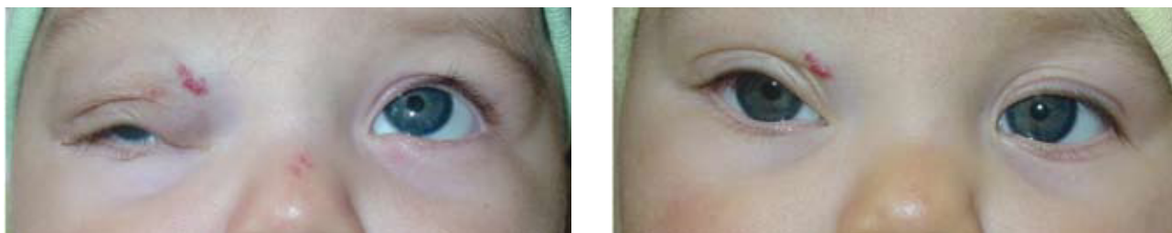
Figura 3. (IZQ y DER) Paciente 2 meses portadora de hemangioma de rápido crecimiento en párpado superior ojo derecho, que le impide abrir el párpado superior con compromiso completo del campo visual sin respuesta a tratamiento corticoideal. (DER) Aspecto post resección quirúrgica intralesional con apertura palpebral adecuada y con remanente de hemangioma en zona que no compromete la funcionalidad, que se deja a evolución espontánea.