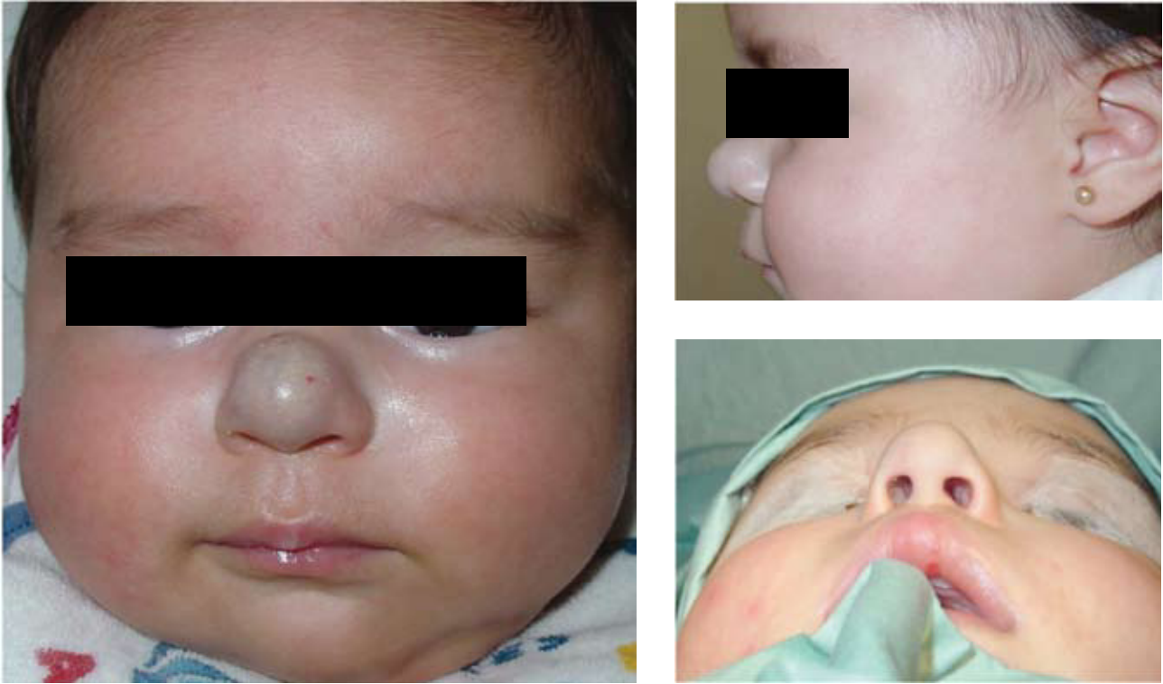
Figura 1. Paciente portadora de hemangioma punta nasal con componente profundo y superficial. Se colocaron 3 dosis de Triamcinolona intralesional (vista frontal, lateral y basal). A los 11 meses mediante incisión marginal se realiza resección quirúrgica de masa fibro/adiposa más reacomodación de cartilagos alares para lograr buen soporte de punta nasal.