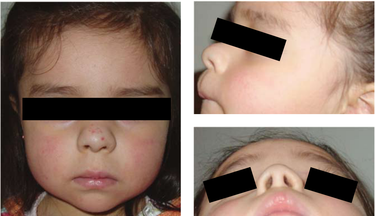
Figura 2. A los 3 años post operatorio, con buen crecimiento nasal. El componente cutáneo se tratará con laser más adelante (vista frontal, lateral y basal).